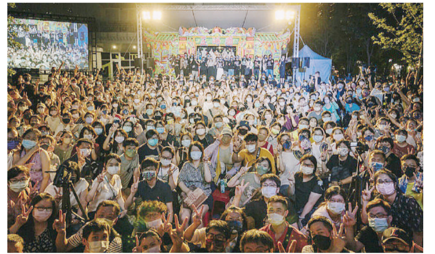
「咱江湖再见」黄文择纪念展16日举行闭幕活动。

全程20多分钟的现场表演, 让观众重新回味庙会看戏的记忆, 让小朋友也看得目瞪口呆, 最后现场观众在影视听中心户外大合唱「中原不败」, 共同合影留念, 场面温馨感人。(中央社)