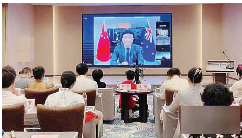
中国驻新西兰奥克兰总领事馆主任领事蒋俊线上致辞。

(桂林讯) 由国务院侨务办公室主办, 广西壮族自治区侨务办公室、桂林旅游学院、桂林市侨务办公室承办的2022年线上中华文化大乐园大洋洲园第一期活动11日在桂林市顺利启动。