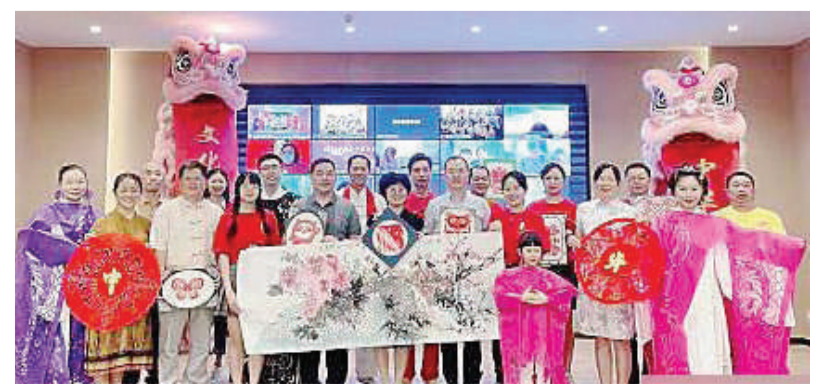
2022年线上中华文化大乐园大洋洲园第一期活动启动仪式现场。

此次线上学习活动为期12天, 将安排趣味汉语、中华经典朗诵、中国书法、中国国画、中国武术、手工才艺等中华传统文化课程, 还安排云游广西、夜游“两江四湖”等自然风光。(中国侨网)