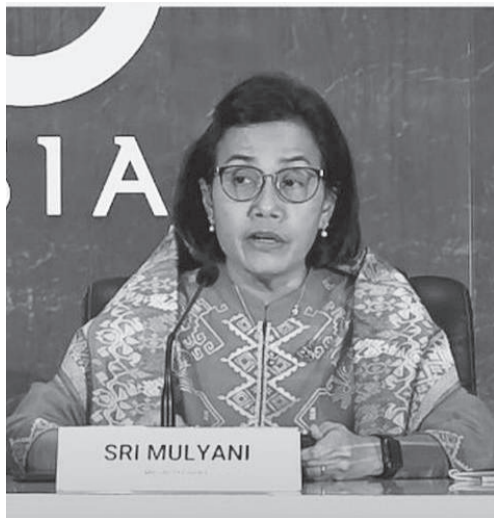
丝丽认为, 发出#停止纳税标签的人不想看到印尼的进步。

度, 如果出现问题, 修复它, 不要放弃。永远不要厌倦爱印尼, 因为爱它需要付出很多努力。”