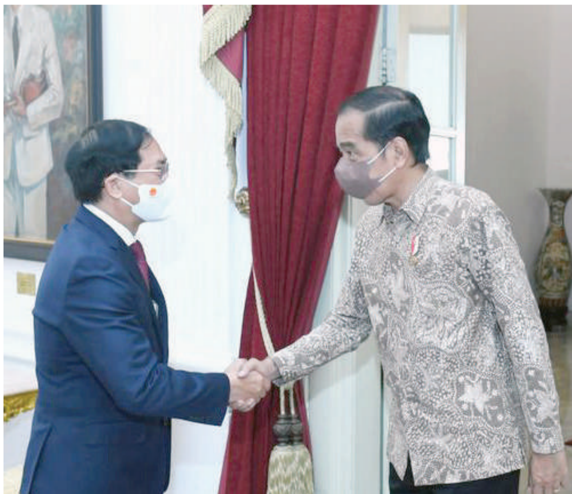
佐科威总统 (右) 与越南外长裴青山握手问好。

(雅加达讯) 佐科威总统于周三 (20日) 在雅加达独立宫, 接待越南外交部长裴青山和代表团的荣誉访问。