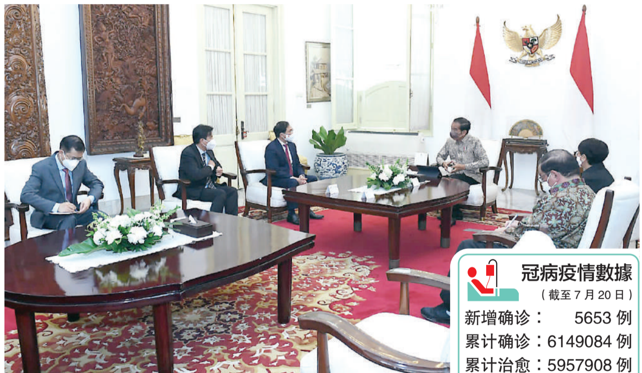
佐科威与裴青山会谈。右二是列特诺。

她说: “我们还表达了越南对印尼于2023年担任东盟轮值主席国的全力支持。” (ALW)