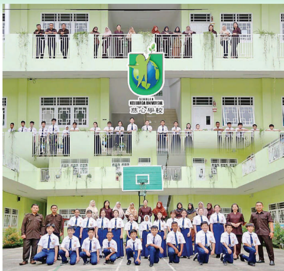
慈心学校部分师生合影。

慈心学校配合政府以国家愿景和使命推进教育事业, 培养学生能力, 塑造高尚品格和文明, 使他们将来能够献身