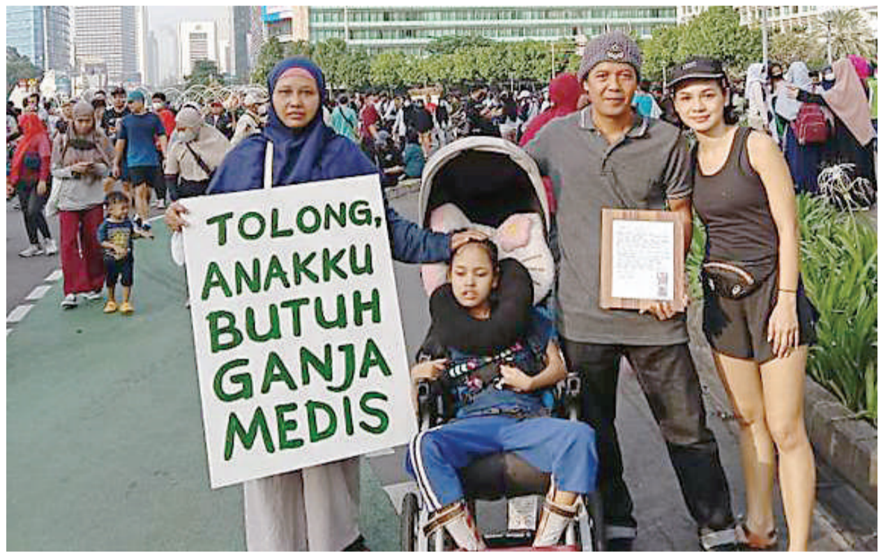
日前一对夫妇请愿, 希望宪法法院就将大麻用于医疗目的做出明智的决定。(档案照)

马鲁夫于6月28日 (周二) 在雅加达 MUI办公室说: “关于『大麻用于』健康的问题, 我认为 MUI 应该立即制定一个教令 (fatwa), 即一个新的教令。” (KP)