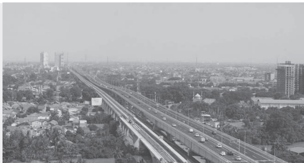
雪克·摩哈玛德·宾·萨耶德高速公路(Tol MBZ)。