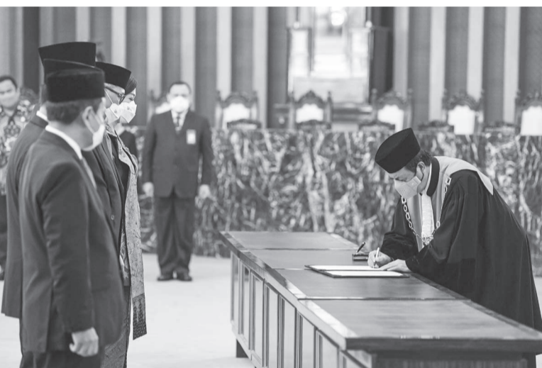
最高法院院长穆罕默德·夏利弗丁(右)进行签名仪式。