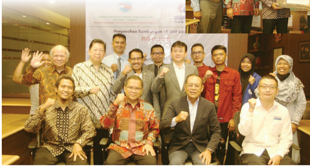
◀与会嘉和习经院诸理事合影。