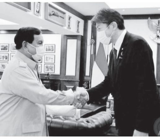
帕拉勃沃(左)接见日本防卫副大臣鬼木诚。

跃,印度尼西亚决心成为未来能够满足本国国防装备需求的国家。 他指出,这项长期政策需要分阶段实施,必须精心策划。 预计这一步骤也将对未来国防工业的独立性产生影响,以减少对进口国防装备的依赖。 帕拉勃沃说:“我们乐观地认为,技术转让合作将按计划进行,并在未来生产出优质的国防装备产品。” 他还对日本防卫副大臣和代表团在加强两国双边关系方面发挥的积极作用表示感谢。 帕拉勃沃希望未来会有新的举措和可持续发展的步骤来进行互利的防务合作。(KP)