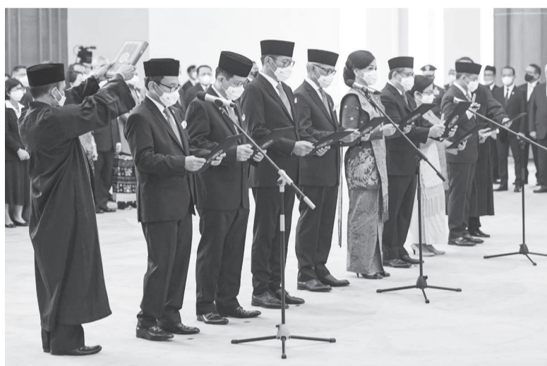
新任金融劳务主管机构专员理事会进行宣誓就职。

通过阿联酋作为枢纽, 打进中东和尼日利亚市场几乎所有我国产品可获得0%进口税率。我将邀约工商会众企业家参加造访各国以进行商业展销。”(MIM)