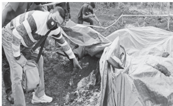
▲调查人员发现一堆大米。