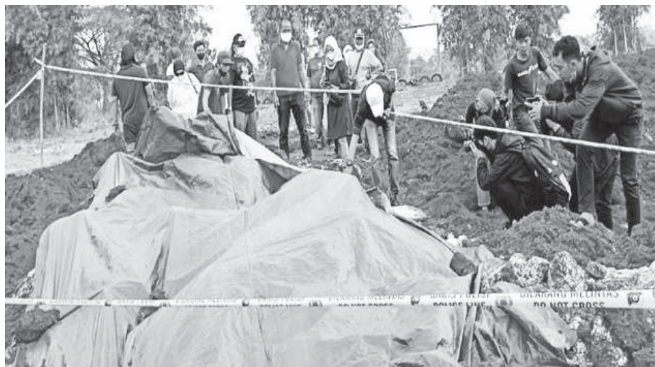
▶文化与人文建设统筹部团队，前往实地调查。