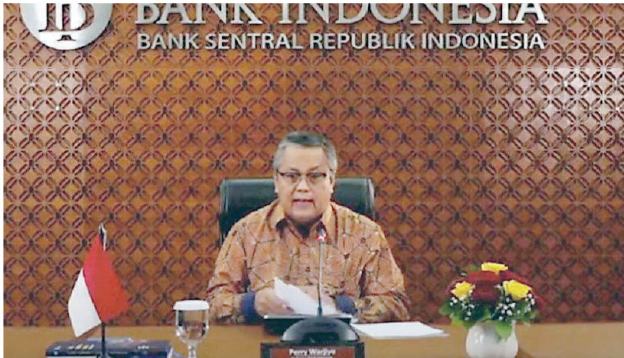
帕利表示, 自斋月以来, 人们的流动性有所改善。

(雅加达讯) 央行总裁帕利·瓦尔齐约预计, 我国2022年第二季度的经济增长将比上年同期 (同比) 达到5.05%。