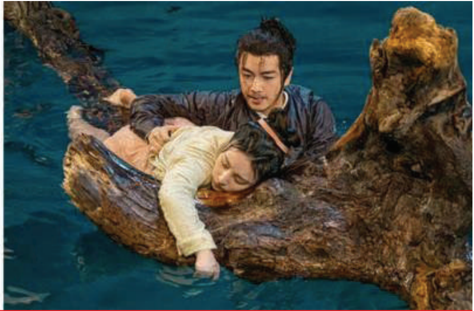
林允(左图)、刘亦菲与陈晓(右图): 具强大收视号召力。