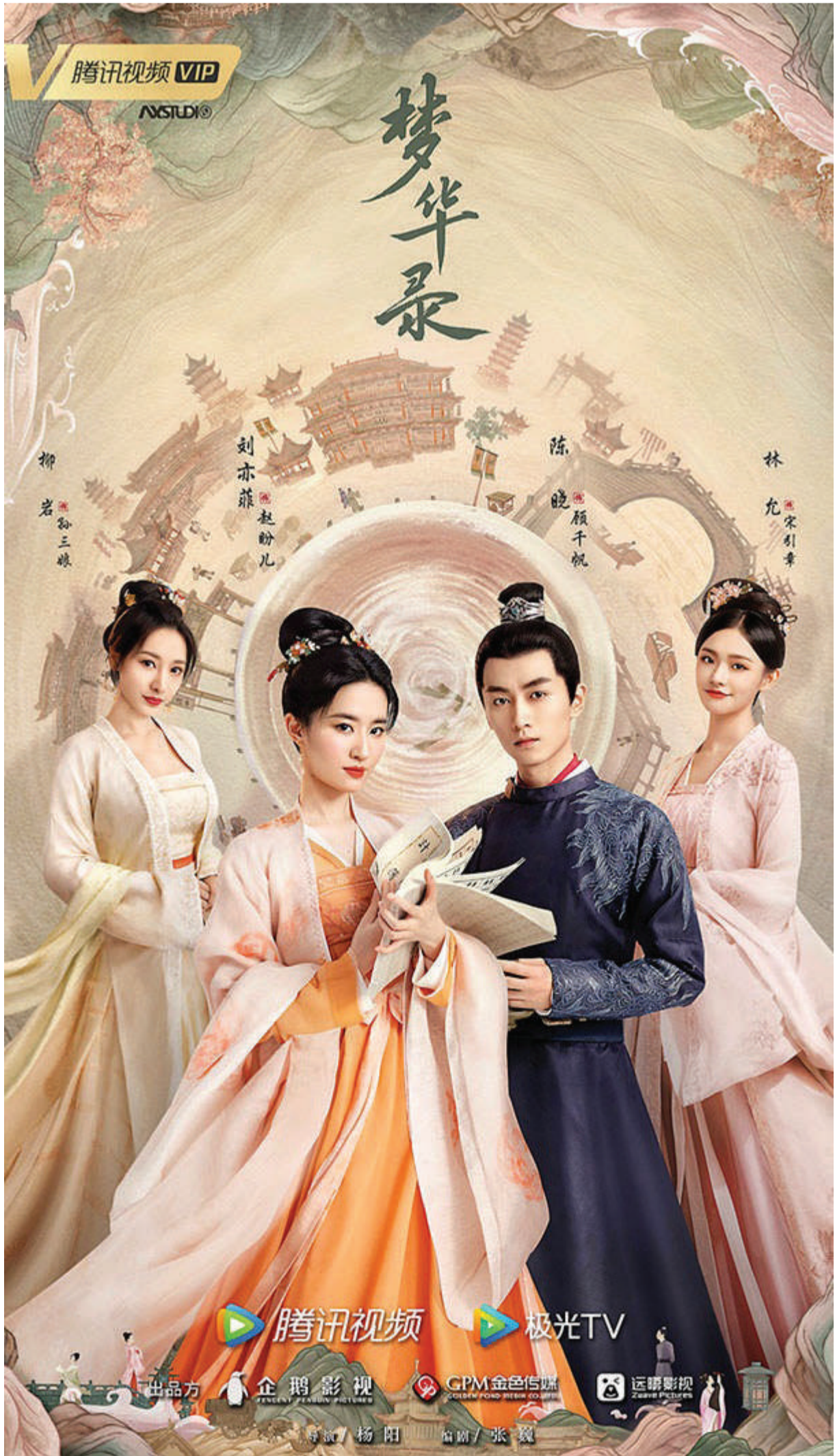
林允(左图)、刘亦菲与陈晓(右图): 具强大收视号召力。

香港翡翠台于早前买下《梦华录》的版权, 计划于myTV SUPER平台上播出, 官方随后亦在微博上宣布这消息。而网飞(Netflix)的收购更使得该剧走出国门, 在韩国及马来西亚的观众群体中都引起热议, 成功焕发中国软实力, 弘扬传统文化。■