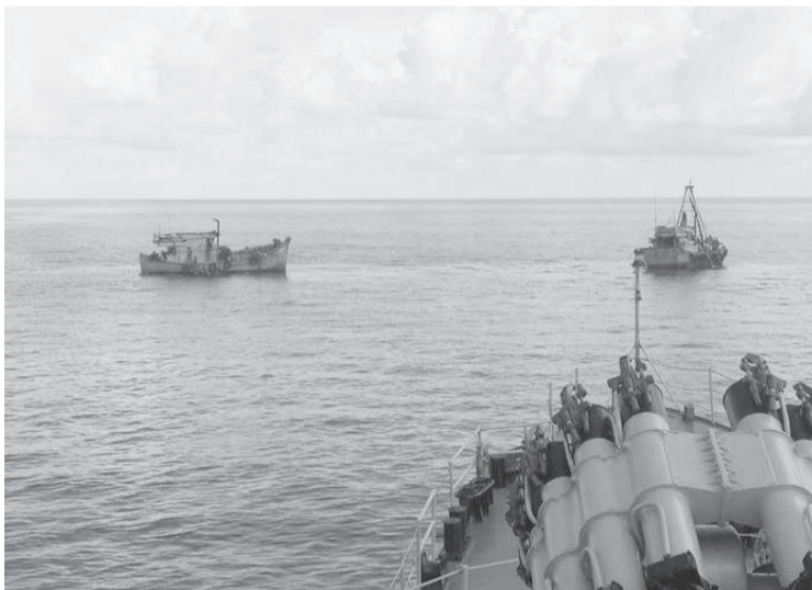
国民军海军扣押2艘悬挂越南国旗外国渔船。

(雅加达讯) 国民军海军通过印尼Cut Nyak Dien-375号战舰，于7月24日(周日)在廖内群岛北纳杜纳海印尼专属经济区，扣押了2艘悬挂越南国旗外国渔船。这两艘船疑是因非法捕鱼被印尼国民军海军扣押。“逮捕这两艘外国渔船不仅维护我国的主权，而且还执