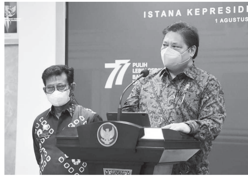
埃尔琅加(右)及夏赫鲁耳一起召开新闻发布会。