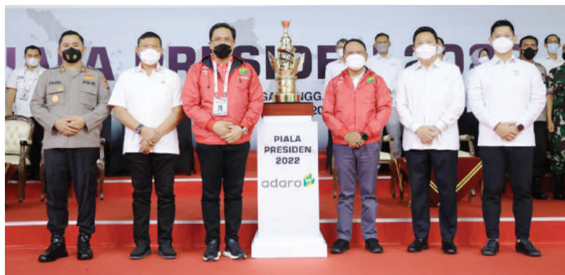
左起: PP PBSI 秘书长 M Fadil Imran、KONI 第二副总主席 Sudarmo、PP PBSI 总主席阿贡、柴努汀部长、Adaro 首席执行官 Garibaldi Thohir 与印尼奥委会总主席 Raja Sapta Oktohari 在总统奖杯前合影。

(雅加达讯) 2022 年总统杯羽毛球锦标赛将于 8 月 1 日至 6 日在东雅加达 Cijantung Kopassus 综合大楼的 GOR Nanggala 举行, 这是 PT Adaro Energy Indonesia Tbk 致力于推动印度尼西亚体育发展的承诺之一。