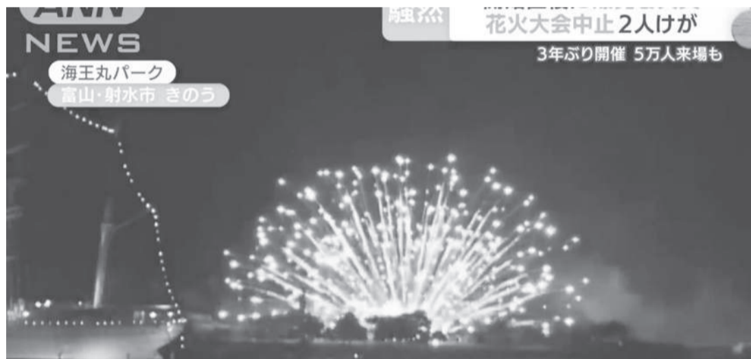
叫”。报道还称,警方表示,发射烟花本次事故造成两名男子受伤。(环球网)的地点发生火灾,约20分钟后被扑灭,报道)

富山县射水市7月31日晚间举行的烟花大会原计划持续30分钟,共发射约2000枚烟花,活动吸引约5万人到场。据报道,在活动开始约8分钟后,有烟花“在地上爆炸”,2分钟后,活动现场的广播通知烟花大会被中止。报道援引视频拍摄者的话称,“当时被吓了一跳……周围也有很多人开始喊