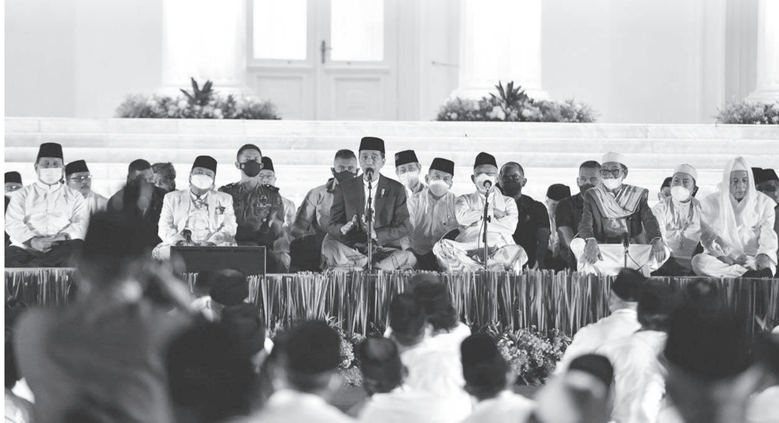
佐科威出席迎接国庆民族祈祷活动。

(雅加达讯) 佐科威总统提醒各方，注意俄乌战争的影响。他披露，目前世界的情况不佳，尤其是在粮食安全方面。但是，印尼应该感激，因为仍然可以生存。