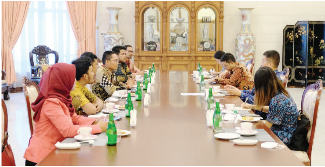
陆慷大使(左四)与伊联中国同学会青年代表亲切交流。

(雅加达讯)陆慷大使7月29日会见伊联中国同学会青年代表。双方就两国教育合作、人文交往等交换意见。