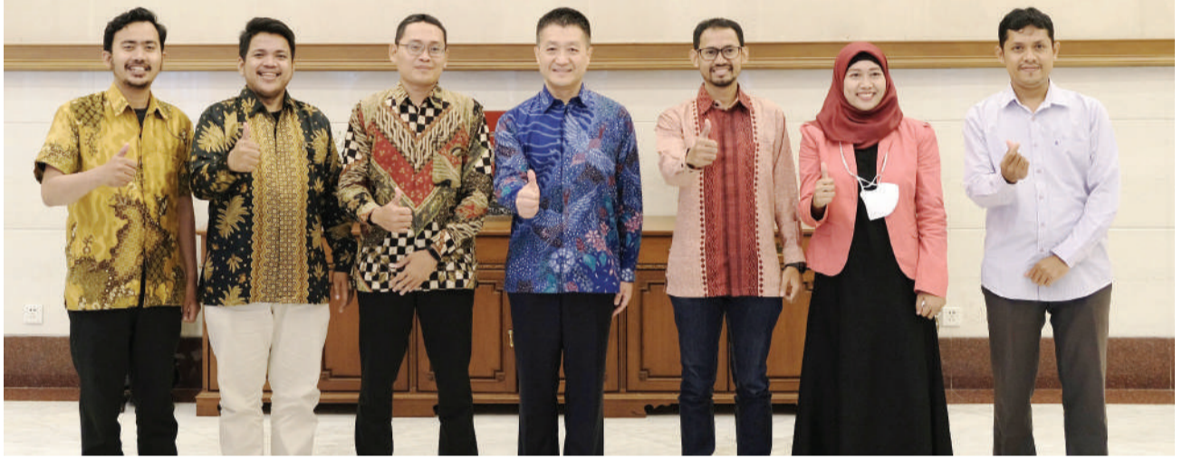
陆慷大使(左四)与伊联中国同学会青年代表合影。