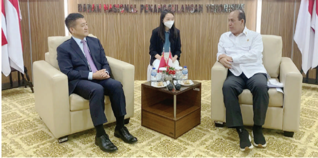
陆慷大使(左)与印尼国家反恐局长博伊(右)亲切交谈。