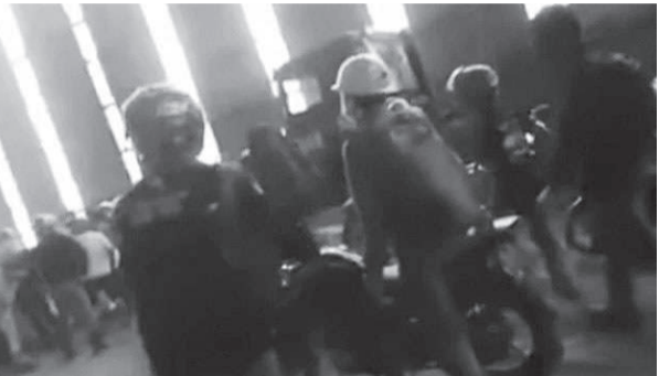
警方到现场维持秩序。