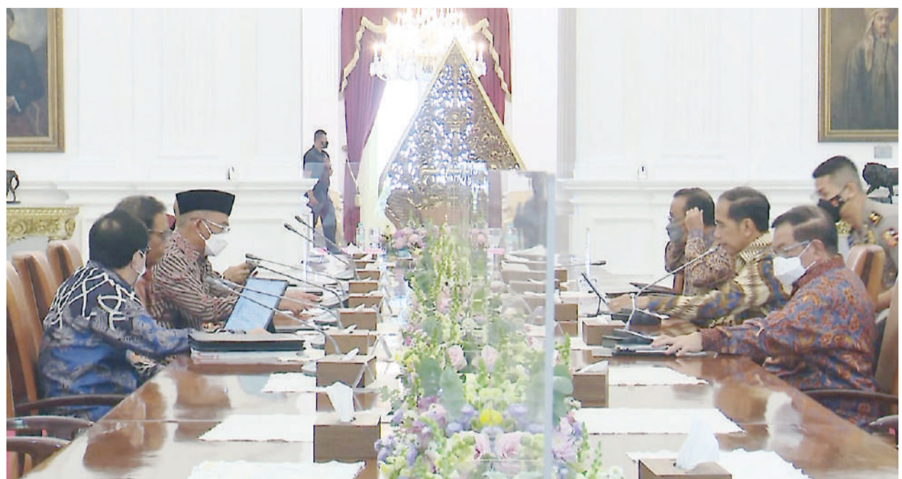
多名部长在总统府会见佐科威总统。