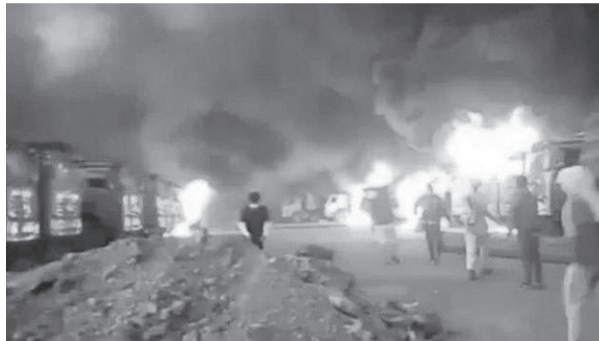
工人放火烧掉推土机及汽车。