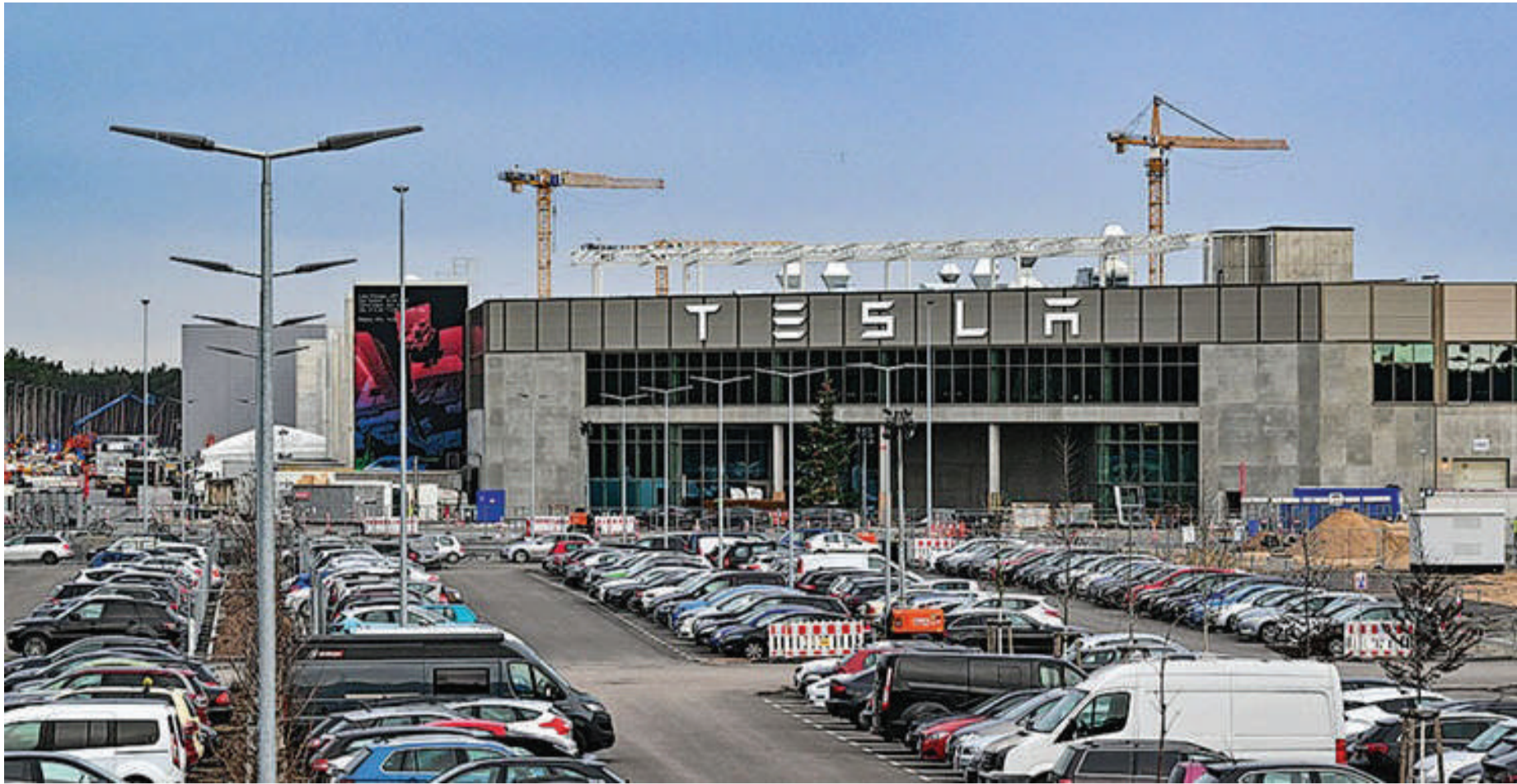
特斯拉德国柏林工厂：从比亚迪购入电池