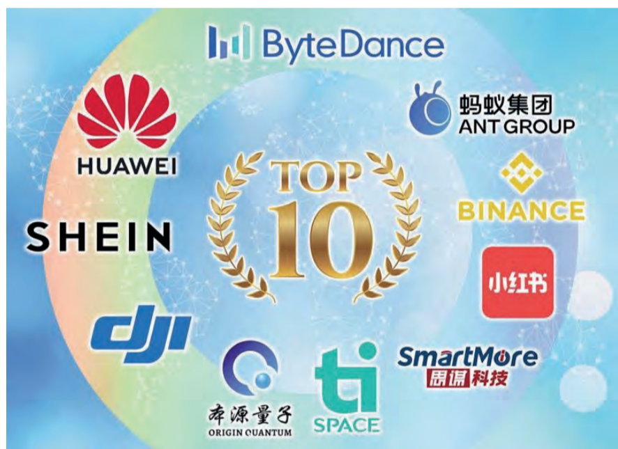
十大创新先锋华商：在各领域中突破创新。

来更在美国封锁下独立自研鸿蒙操作系统（HarmonyOS）与高端芯片，足与苹果、谷歌分庭抗礼。