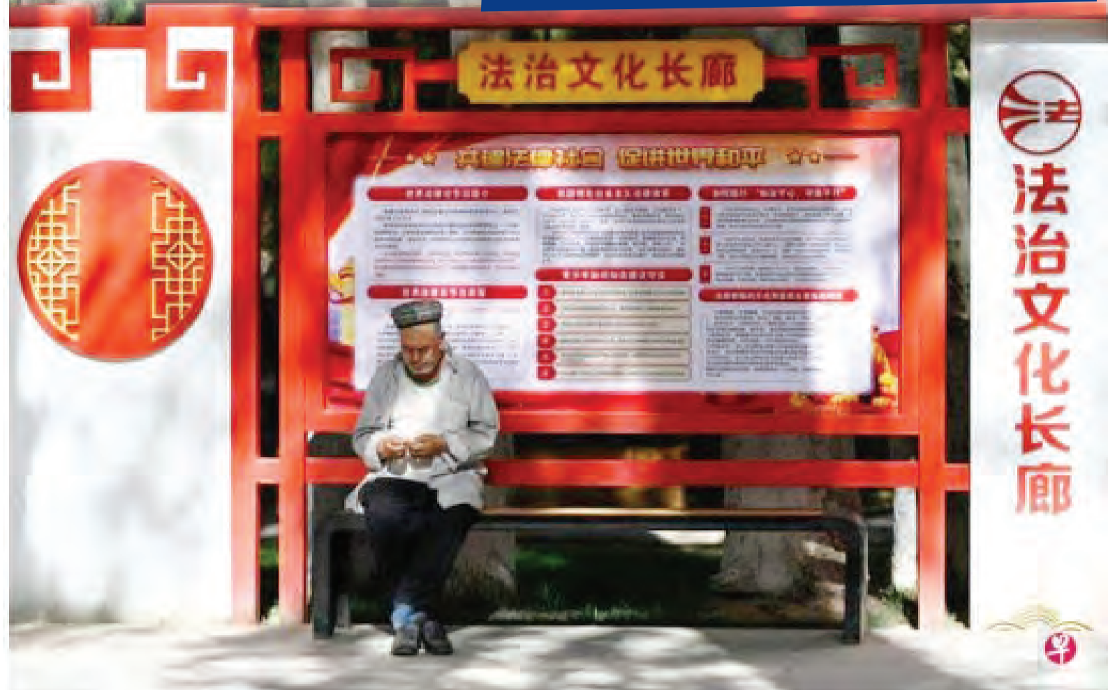
美国8月再以新疆、西藏等问题对中国施压后，中国官方星期六(8月26日)时隔一年再度视察新疆，要求把维护社会稳定摆在首位，并有针对性地批驳各种不实舆论。

受访学者分析，中共高层上周接连视察边疆地区，明显是对美国新政策动向的警惕，有意通过调研预防美国言论对少数民族地区造成影响。