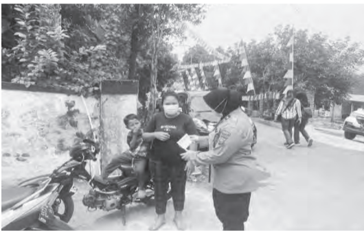
▲警员分发口罩给居民。