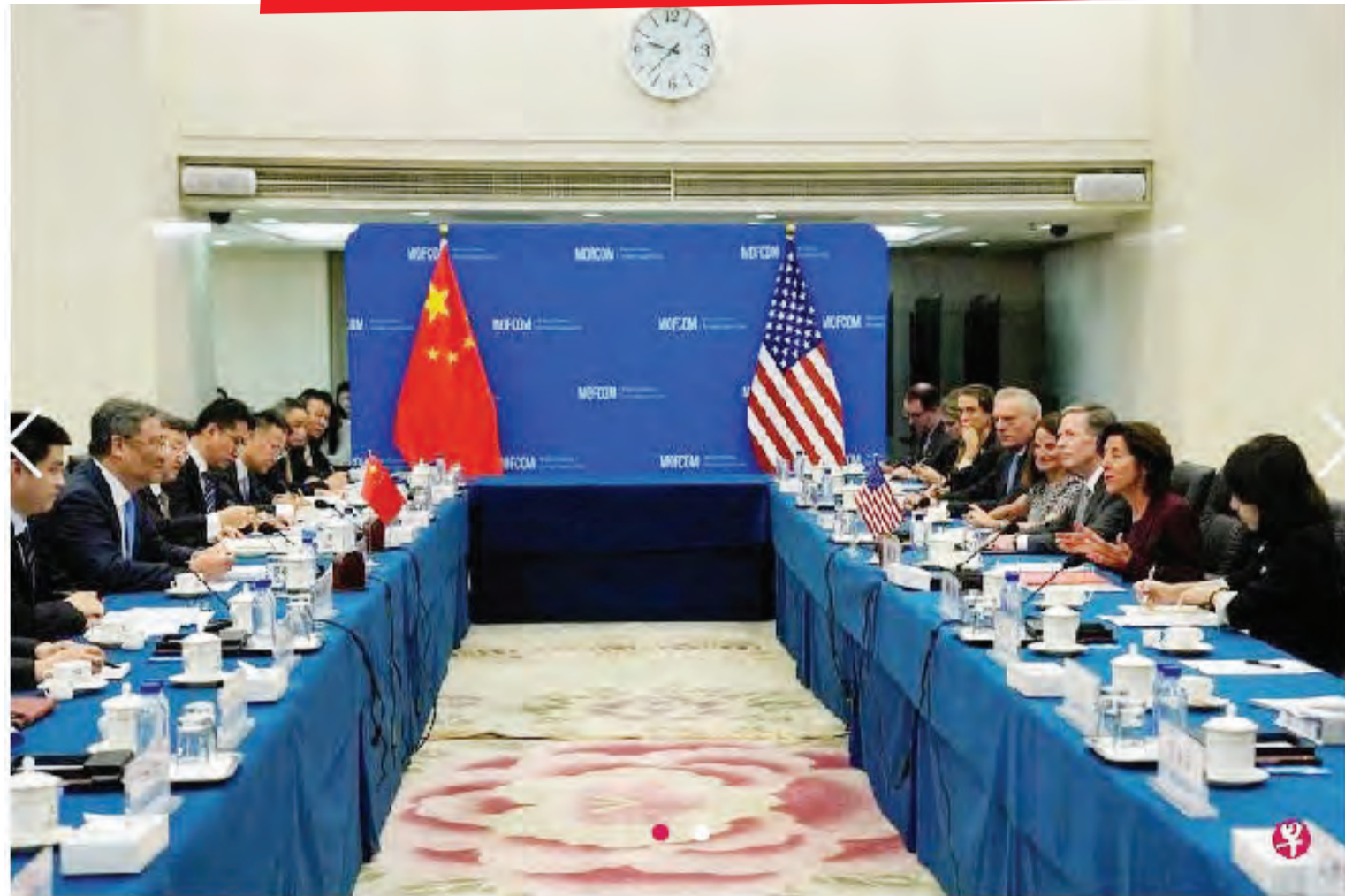
美国商务部长雷蒙多星期一（8月28日）早上在北京与中国商务部长王文涛会面时强调，确保美中两国之间的经济关系稳定极其重要。