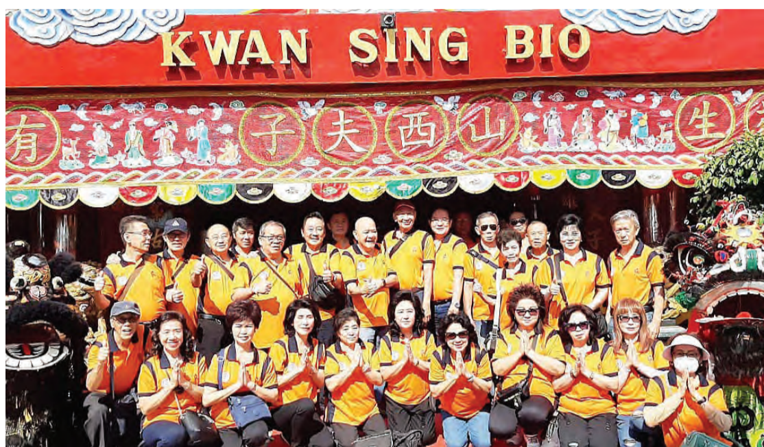
万隆慈善仁爱团队在关圣庙前合影。

文娱节目有泗水文庙舞狮队娱乐来宾，有各种饮食摊位，主办单位供应免费住宿与饮食给千多名来宾。