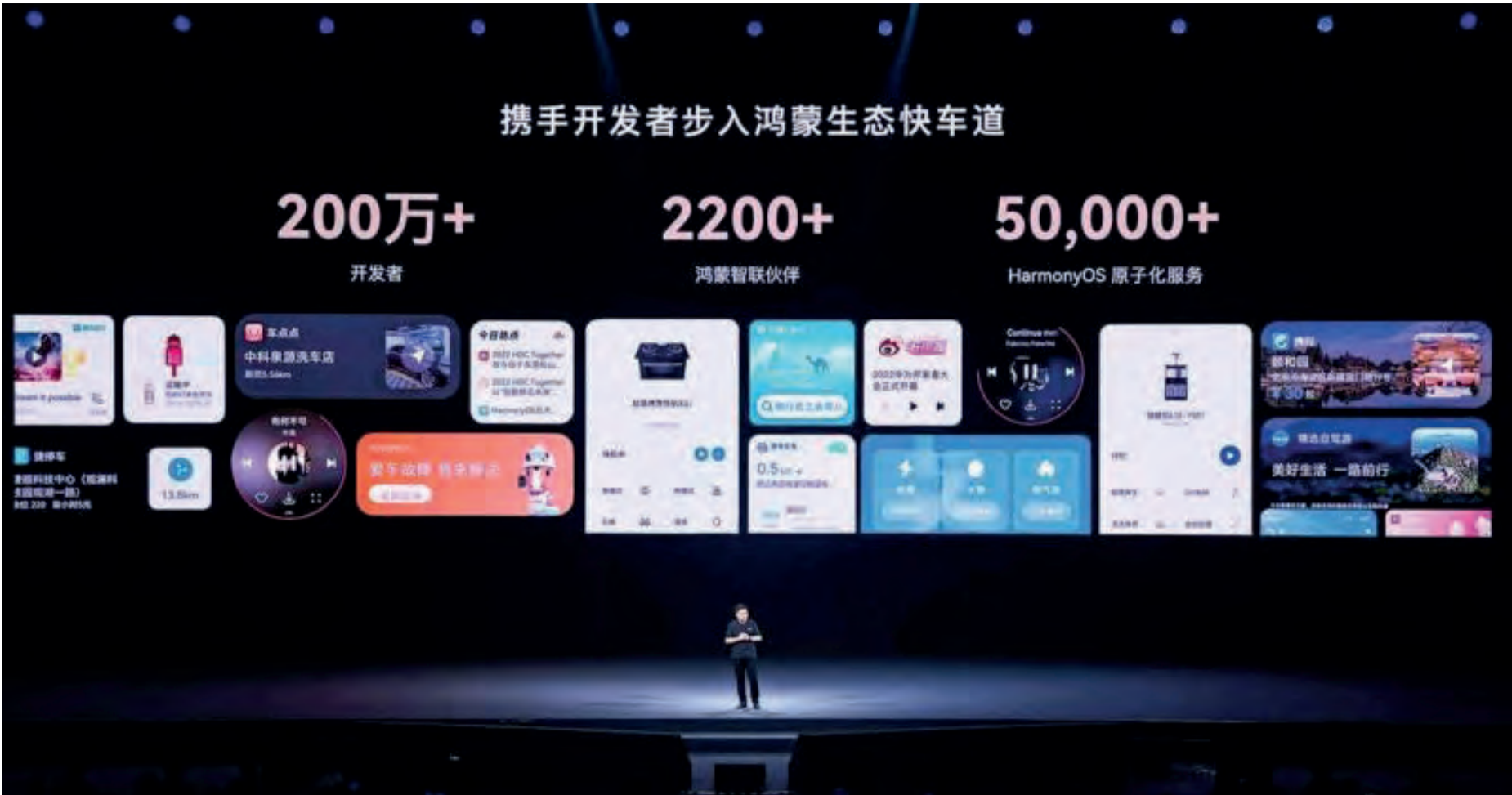
华为开发者大会二零二叁：发布HarmonyOS 4。