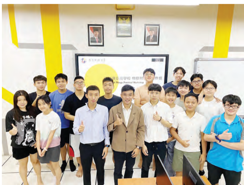
开训典礼师生相见欢。