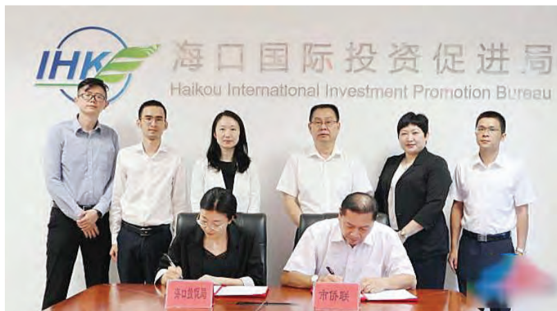
海口投促局与海口市侨联签署合作协议。

海口是海南省三大侨乡之一, 全市现有归侨侨眷30多万, 旅居海外的侨胞50多万。近年来海口高度重视与广大侨界资源对接, 侨界已成为海口经济社会发展重要力量和推广海口的有效载体。今年以来, 海口投促局通过搭建境外招商网络、联络当地华侨华人资源等方式, 先后赴泰国、柬埔寨、瑞士等国家和地区开展系列招商引资工作, 与海南自贸港侨海创新创业园签订合作协议, 明确共同构建共创、共赢、共享的招商合作机制。下一步, 海口还将联合广大海外侨界资源, 谋划在欧洲、非洲、东南亚等地开展系列招商推介活动, 进一步深化全球贸易投资领域合作, 推进高水平对外开放。(完)