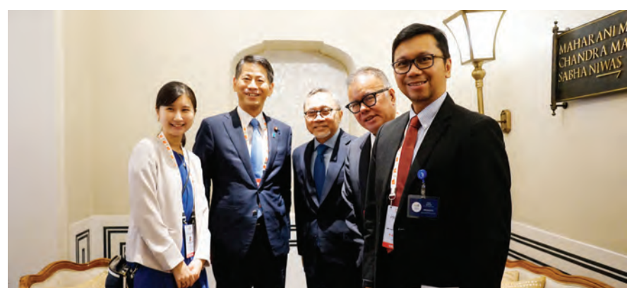
楚尔基弗里 (右三起) 及林芳正与随行人员合影。

网的突破，其中岛际的互联网成为我们的优先项目。因此，该步调也随着东盟电网作为维护东盟区能源安全部份的精神。” 马来西亚国能公司总经理兼首席执行官纳都·峇哈林表示欢迎该合作，通过该合作可以加强印马两国双边合作关系。 另一方面，该合作也能加速在两国所发展清洁能源。 峇哈林说，“此事也成为国家能源有限公司在深入所提倡环保联合合作设法加固可靠性和东盟电网互联的韧性，以及推动在东盟区的综合再生新能源中重要的里程碑。” 他说，该合作也成为利用充裕的再生新能源资源作为基础来推动多出的电力分配，以激发经济增长，并实现全东盟成员国的能源储备安全。 与此同时，沙巴电力有限公司首席执行官雅各·查法尔表示赞同所建东盟电网突破点项目。 (MIM)