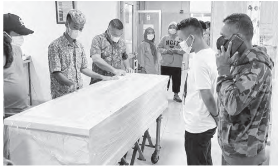
死者的遗体被家人领出安葬。

拉法尔叙述称, 如果RM一等兵被证明正如在社交媒体上疯传的展开施暴行为, 将受到法律处理。