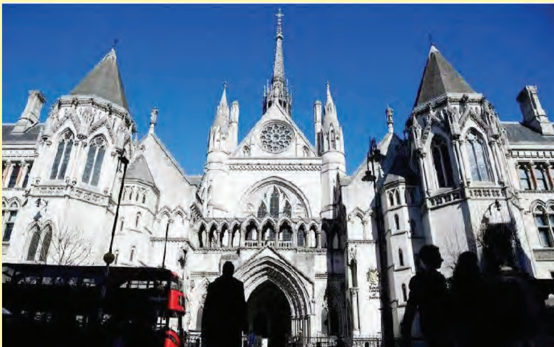
英国政府计划修订法律,要求法官对犯下最可怕谋杀案的凶手,实施强制性“终身监禁命令”。 (早报)

下最可怕谋杀罪行的罪犯实施强制终身监禁,我们将确保他们永远不会逍遥法外。” (早报)