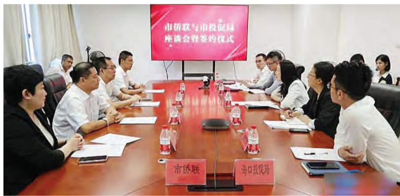
海口投促局与海口市侨联开展座谈。

海口国际投资促进局(下称海口投促局)与海口市归国华侨联合会(下称市侨联)日前在海口举行工作座谈并签署合作协议。双方将建立常态化合作机制, 充分发挥广大侨胞侨商海内外资源优势, 推动更多优质外资项目落地海口, 共同助力海南自贸港核心区和现代化国际化新海口建设。