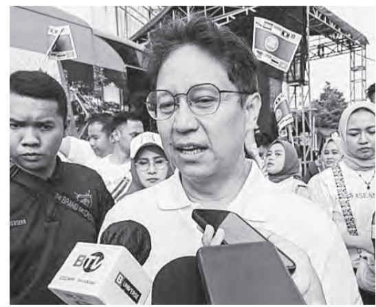
布迪要求所有社会保健中心, 每周测量空气质量。