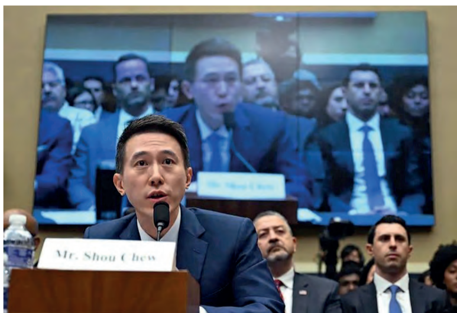
TikTok执行长周受资，出席美国国会听证会会被针对