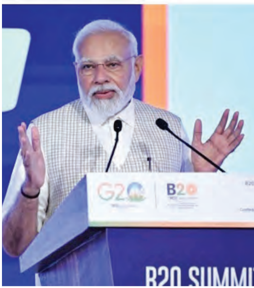
印度总理莫迪在G20商业峰会上发言,邀请非洲联盟加入G20。