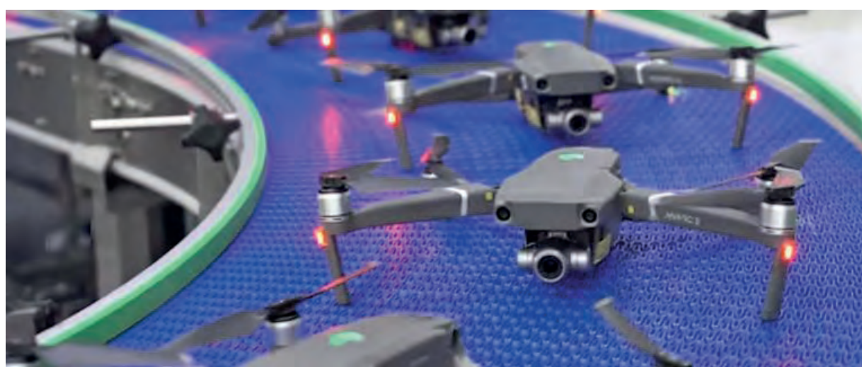
大疆生产线：展示强劲生产力。