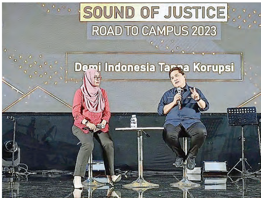
雅立多斯(右)在活动中发表演讲。

阿迪塔解释说,除了全程仅需5000盾的统一收费外,下一个计划是对最远距离征收最高2万盾的车资,对最远距离以外的其他距离征收低于2万盾的车资。该车资促销计划从2023年10月初开始至2024年2月结束。(ALW)