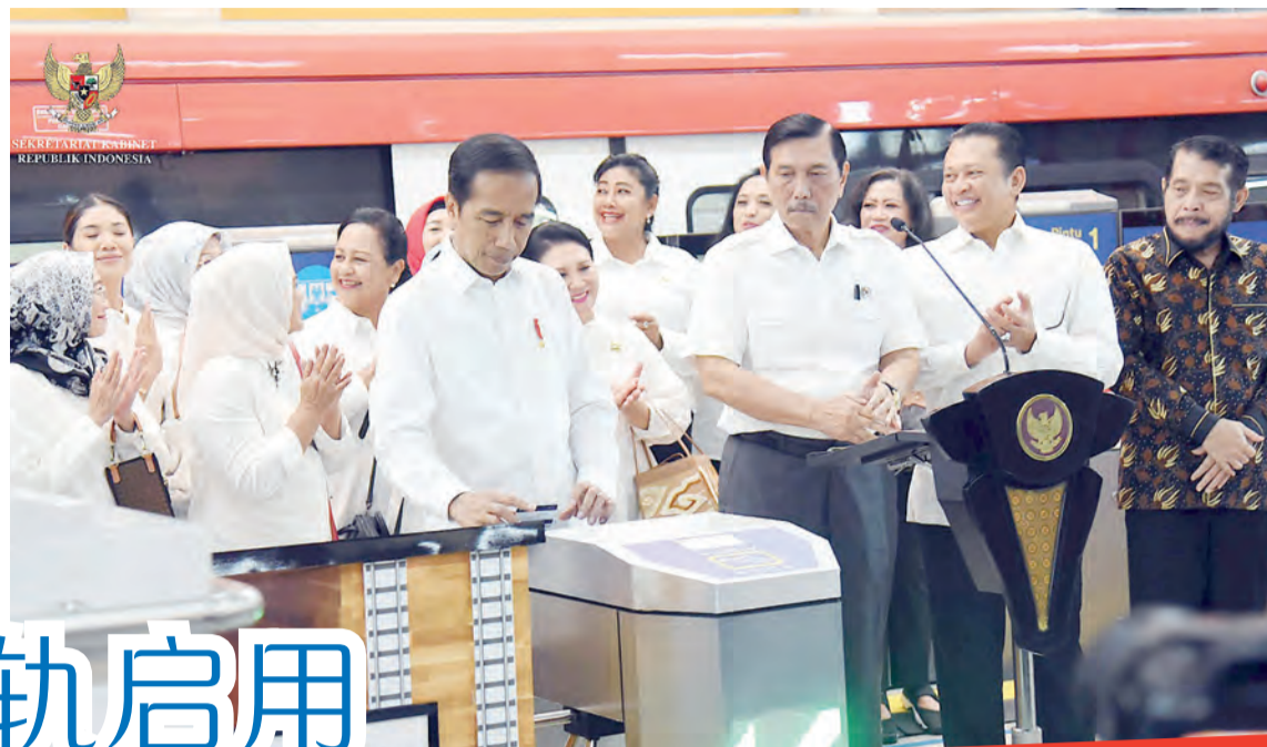
车启用。佐科威点击电子卡，作为象征轻轨运营通