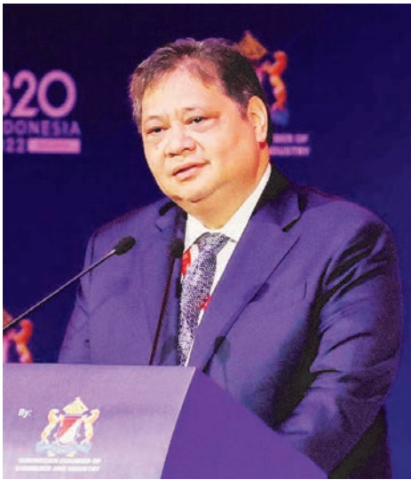
经济事务统筹部长艾尔朗加4月6日首次对美国征收关税作出回应。

（雅加达讯）印尼经济事务统筹部长艾尔朗加说，印尼不会对美国总统特朗普对印尼征收32%的贸易关税进行报复。 路透社报道，艾尔朗加星期天（4月6日）首次对美国征收关税作出首次回应。 他发声明说，在特朗普星期三（2日）宣布全面征收全球关税后，印尼将通过外交和谈判寻求互利解决方案。 “采取这个做法是考虑到双边贸易关系的长期利益，以及维持投资环境和国家经济稳定。” 他也说，雅加达将支持可能受到影响的行业，如服装和鞋类行业。 艾尔朗加说，印尼政府将于星期一（7日）收集企业的意见，以帮助制定应对美国关税的战略，并将寻找增加与欧洲国家贸易的方法，以替代美国和中国。 印尼也将派遣高级代表团前往美国与政府进行直接谈判。 特朗普对印尼征收的关税将于下星期三（9日）生效，印尼是东南亚六个受影响最大的国家之