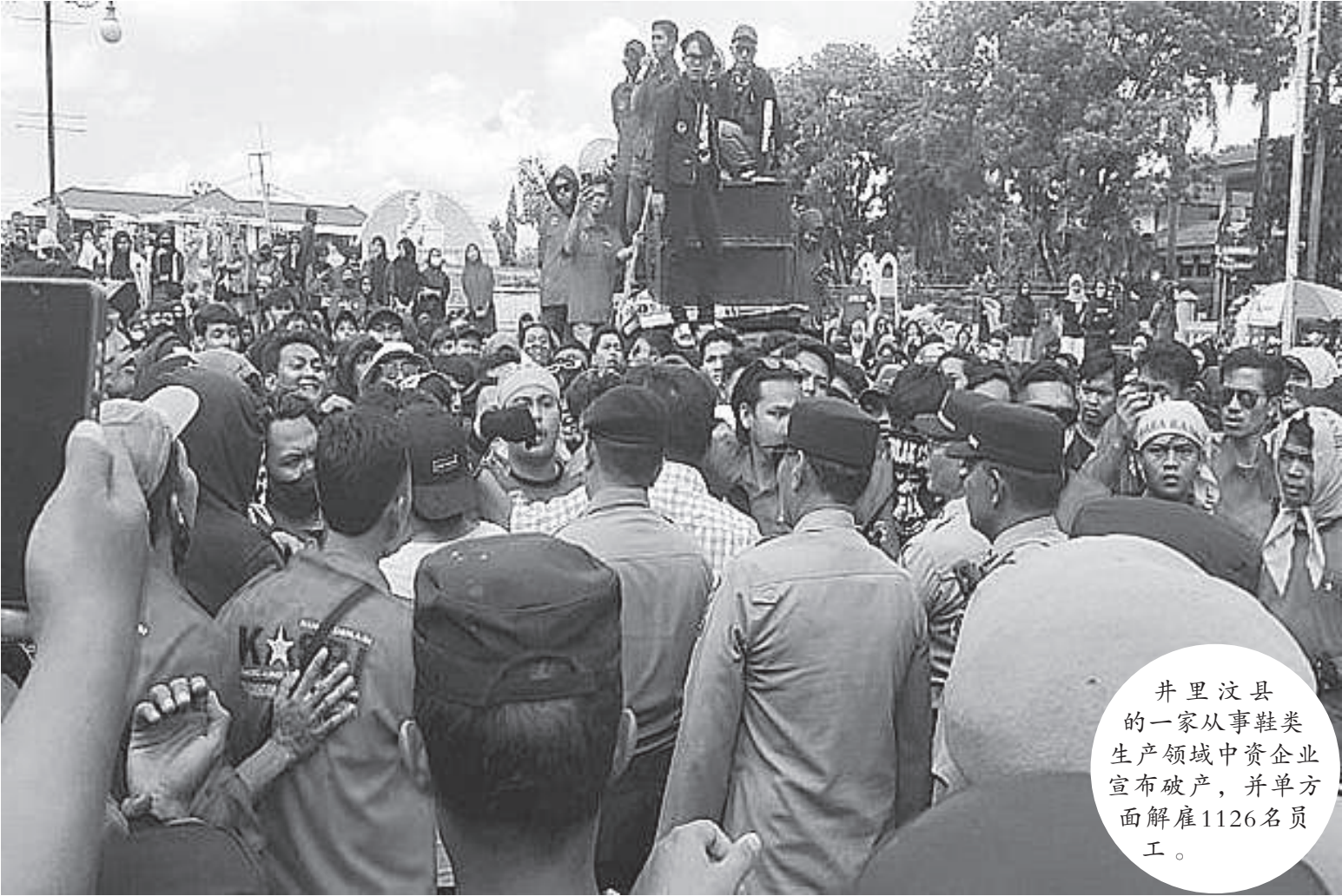
井里汶县的一家从事鞋类生产领域中资企业宣布破产，并单方面解雇1126名员工。

（井里汶讯）在临近今年开斋节，西爪哇省井里汶县的一家从事鞋类生产领域的中资企业宣布破产，并单方面解雇1126名员工。 据了解，被解雇的这1126名员工，通过各种方式，争取所应得的权利，他们从今年斋戒月至临近开斋节，进行示威活动。 示威者表示，公司因不明原因解雇