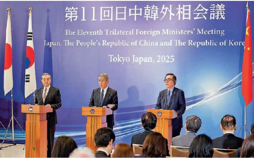
中国外长王毅（左起）与日本外务大臣岩屋毅和韩国外交部长赵兑烈在东京举行会议。

韩国外交部长赵兑烈表示，为了实现三国合作机制化，加强实质性合作，应该定期举办韩日中领导人峰会，确保三国合作势头没有阻断，这尤为重要。赵兑烈还表示，为了让三国民众切身感受不断加强的三国合作，需将重点放在与民生息息相关的项目上，强化实质性合作。民众之间人员往来，是加强三国合作的核心基础。有句成语曰：「三者成全，万物皆美。」这意味着三者聚合在一起，可以形成更大更稳定更完美的成果。■