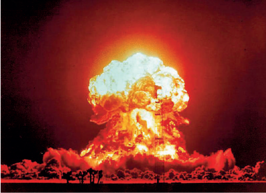
核弹试验：1964年，中国大陆核武试爆成功，让台湾政府深感威胁。