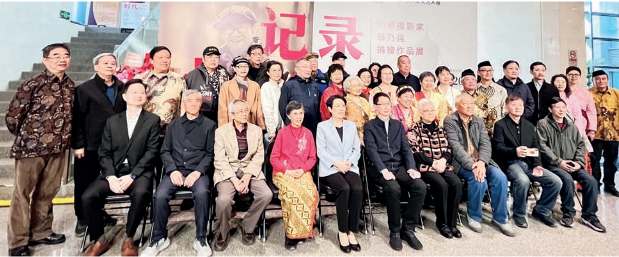
与莅临开幕仪式的领导合影。