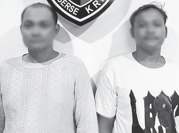
勿加西巴鲁巴刹蔬菜商贩勒索的肇事者。

（雅加达讯）两名歹徒勒索菜贩的信息在社交媒体上爆红，即将被关进派出所服刑。两人因在西爪哇省勿加西敲诈并踢一名蔬菜小贩的商品而被警方逮捕。 这起事件发生在勿加西市巴鲁巴刹，该事件在网上疯传。一段广为流传的视频中，一名身穿红色衬衫和帽子的男子正在斥责在路边卖菜的女卖菜员。 肇事者要求商贩关闭他的摊位。“卷起来，卷起来。”红衣地痞对卖菜的厉声说道。 “你知道我是谁？”敲诈者炫耀他的权威说