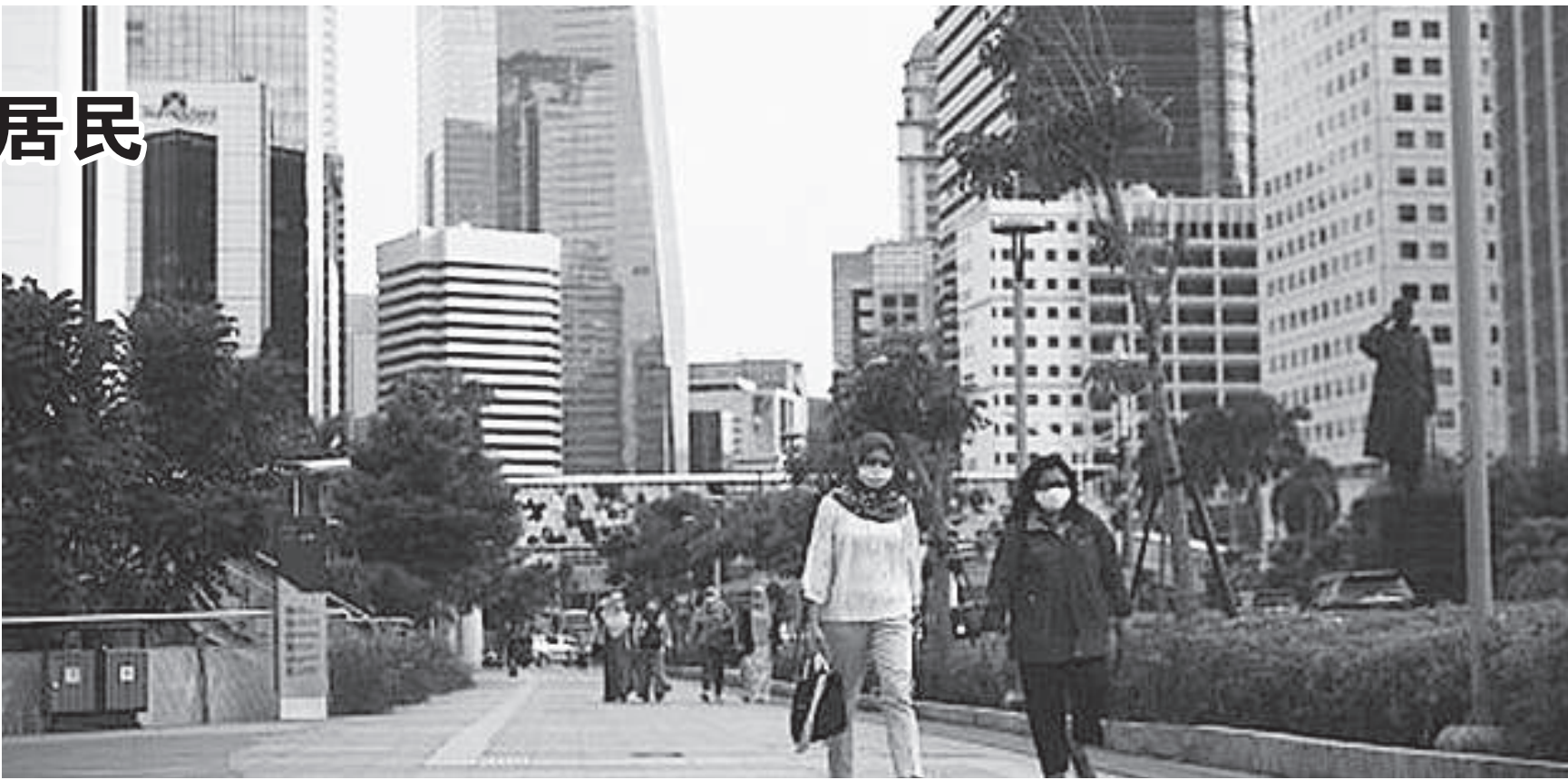
雅加达开斋节后预计迎来五万名新居民。

拉诺说：“实际上，雅加达省长已向进入雅加达的民众，他表示“请来”。 我们不执行司法行动，因为雅加达是属于我们的。但，我们希望，计划在雅加达工作的新民众拥有技能，和雅加达原有民众公平竞争。我们将进行数据收集。目的不是禁止他们进入雅加达，而想了解新民众的数量。” 省政府希望，计划在雅加达工作的新居民要拥有一定的技能，让他们的竞争力不比雅加达居民差。（美都新闻）