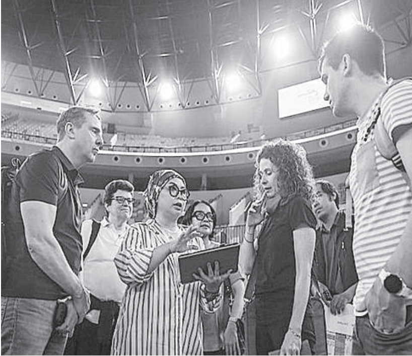
国际体操联合会 (FIG) 对印尼主办第53届世界体操锦标赛充分准备表示高度赞赏。