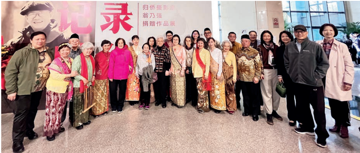
参加开幕仪式的印尼归侨和侨二代。