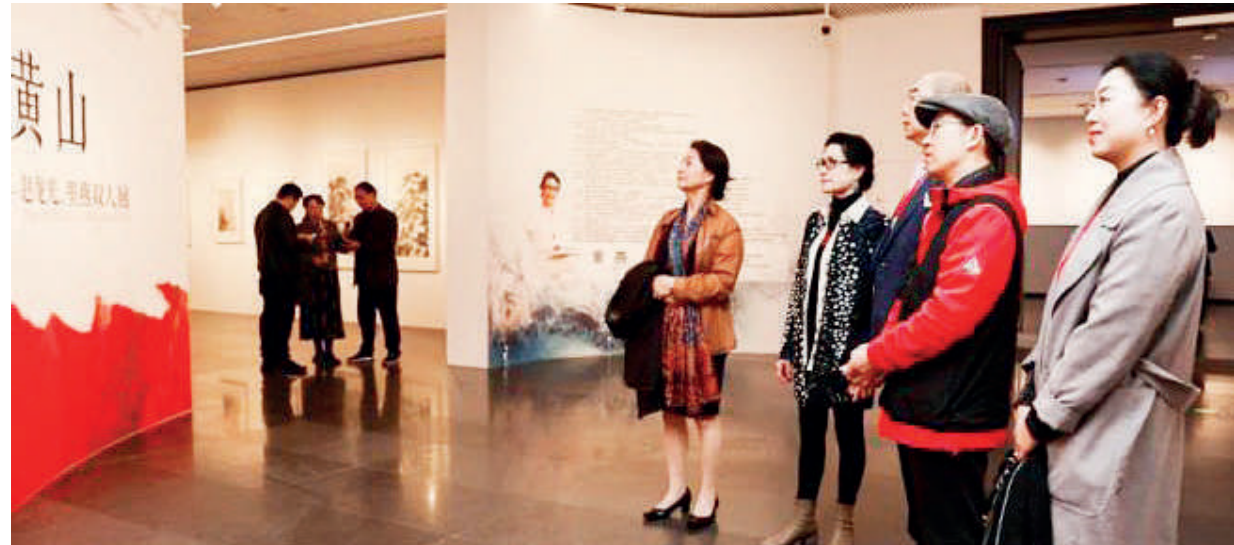
展览现场，与会嘉宾观展。

本次展览由安徽省人民政府侨务办公室、中国致公党安徽省委员会、安徽省归国华侨联合会共同主办，展出时间将持续至4月6日。（中新网）