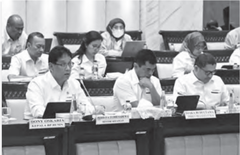
普尔巴亚及多尼出席与国会第十一委员会的工作会议。