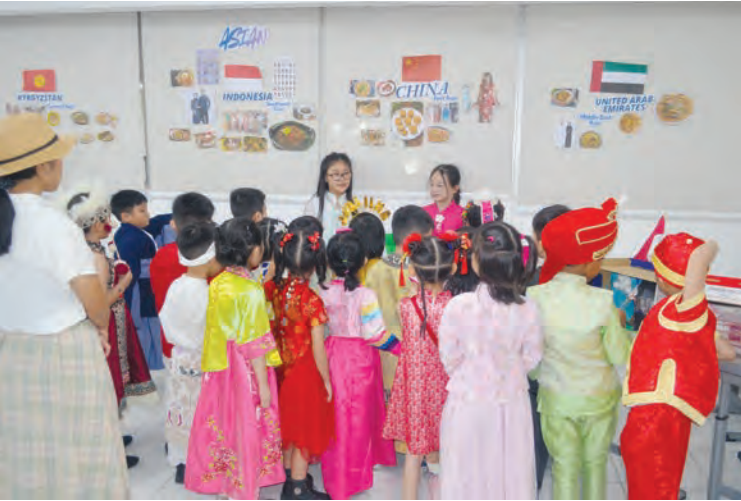
学生小导游推荐中国美食文化。

上午8时，一、二、三年级的学生率先登场，带来备受期待的国际服装秀。孩子们身着来自不同国家与文化背景的传统服饰，色彩鲜明、细节精致；他们自信走上舞台，姿态可爱又大方，宛如一场迷你“世界文化巡礼”。 在服装秀中，各种精美服装造型令人目不暇接：有的孩子戴着宽沿草帽、披着彩条披肩，手里抱着小吉他，在灯光下再现拉丁风情；有的穿上传统羽饰头冠，脸上点缀部落图腾，走台步时气势十足；也有学生穿着代表美国文化的星条服饰，高顶帽、披风和亮色西装外套在舞台上格外抢眼；还有学生化身维多利亚风格的小绅士与小淑女，优雅的裙摆、整齐的礼服营造出浓浓的欧洲古典气息；穿着中国旗袍与唐装的学生气质十