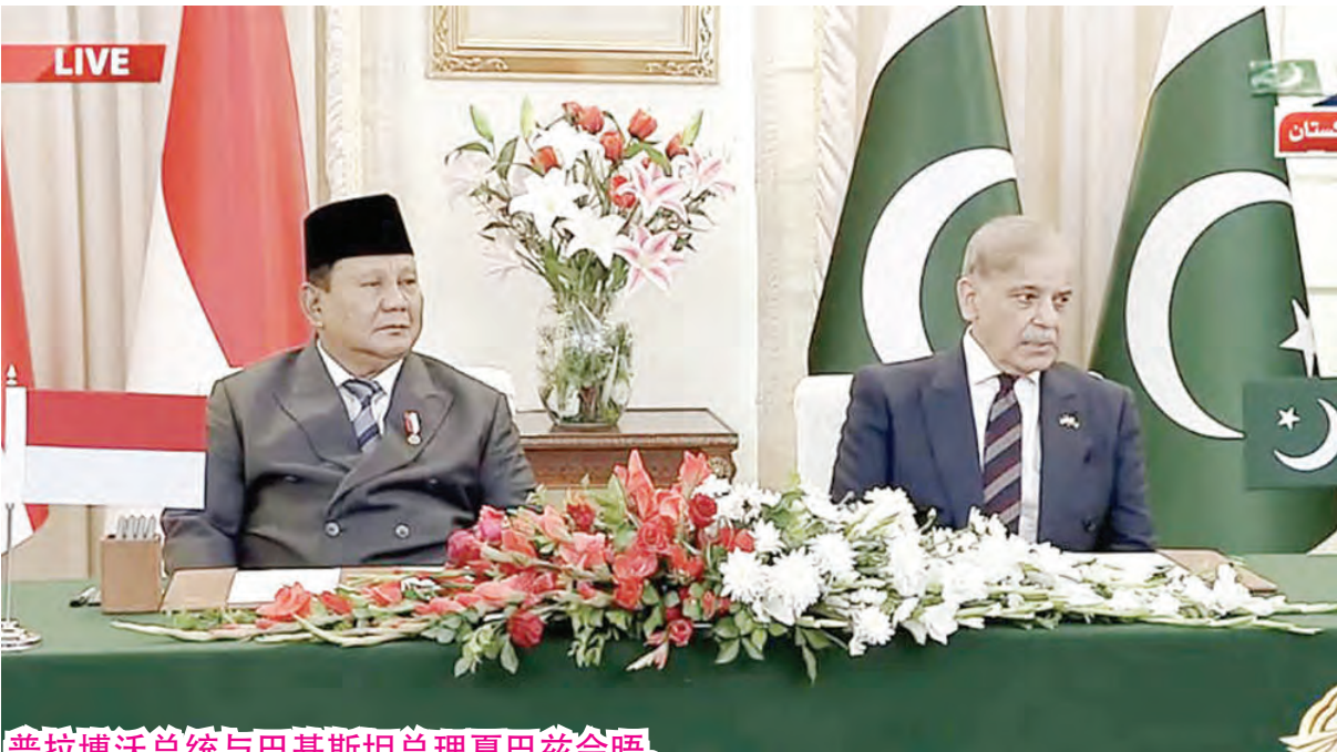
普拉博沃总统与巴基斯坦总理夏巴兹会晤。

在国家社会经济单一资料发布之前，印尼没有关于残疾人的统一资料库。透过DTSEN，政府现在掌握了印尼全国残疾人的全面信息，包括他们的生活水平和详细的残疾类别。