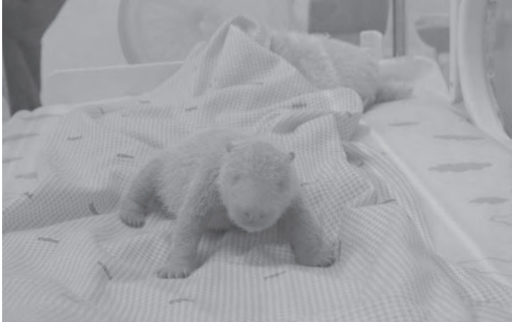
熊猫幼崽被命名为“里奥”。

内, 里奥预计将开始睁眼、长出毛发、具备自我调节体温能力, 并出现早期运动行为。