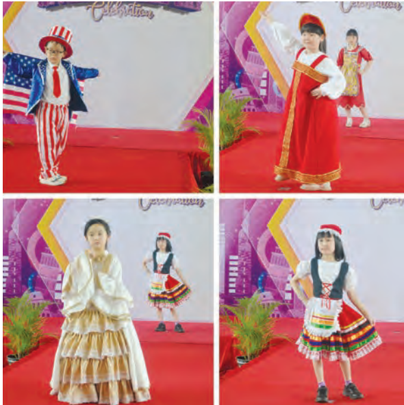
小学生各国传统服装秀风采。

足，精致的盘扣与刺绣图案展现东方之美。来自中东、欧洲、非洲等地区的服饰也纷纷亮相，孩子们自信地在舞台上展示、旋转、摆姿势，尽显各国文化的独特魅力。 与此同时，活动现场的展卖区也同步开放，由四、五、六年级学生负责营运。摊位上摆满来自不同国家和地区的点心及小吃：有印尼传统糕点、西式甜点，也有东南亚、欧洲及美洲风味的小点心。学生不仅负责准备与摆盘，还主动介绍食物的来源与特色，让前来品尝的师生们在美味中学习不同国家的饮食文化。 今年国际日活动还有一大亮点是：四、五、六年级学生精心打造的“五大洲主题教室”。每间教室代表一个“洲”，相应地布置不同国家的特色文化，通过图片、文字、手工作品等，让人仿佛瞬间“穿越”到世界各地。四、五、六年级的学生化身“小导游”，带领低年级的学弟学妹参观各个主题教室。他们用耐心讲解各国的语言、文化、美食与建筑特色，让参观者在轻松互动中感受世界文化。