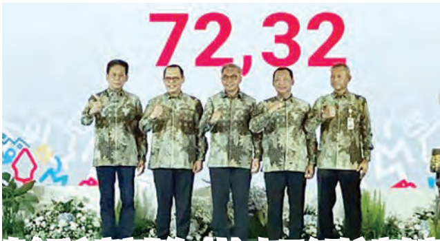
肃贪委主席塞蒂约（中）与四名副主席出席2025年诚信评估调查结果汇报会。

（日惹讯）肃贪委员会公布了2025年诚信评估调查（SPI）结果。印尼2025年的国家诚信指数为72.32分，较2024年的71.53分有所提升。