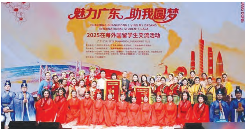
2025“魅力广东 助我圆梦”在粤外国留学生交流活动近日圆满落幕。

据了解，《千手之舞》由来自印度尼西亚的32名华文教育系本硕留学生共同演出，源自印尼历史悠久的传统舞蹈“沙曼舞”。该舞蹈2011年被列入联合国教科文组织“急需保护的非物质文化遗产名录”。留学生们以跪坐姿排成紧密队列，通过弹指、拍击身体与地面，配合整齐划一的摇摆与转动，在宏大的节奏中传递善与爱的普世理念。师生们在传承原舞风貌的基础上进行精心编排，既展示了印尼非遗的独特魅力，也体现了与中华文明交流互鉴的主题。