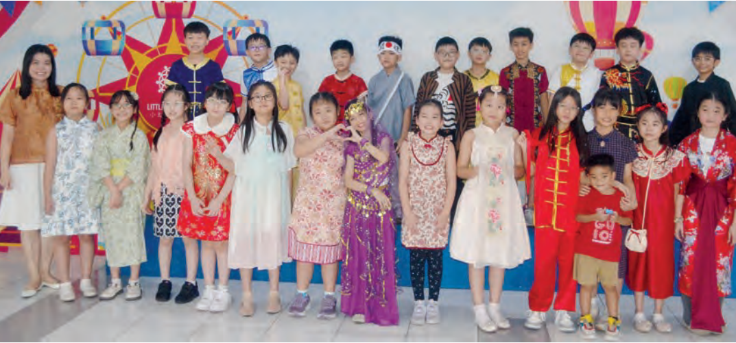
学生们身着各国传统服装合影。

活动在欢声笑语中圆满结束。此次国际日活动展示了学生们的创造力与舞台魅力，通过亲身参与、动手布置、舞台展示与跨文化交流，让学生们在体验中学习，在合作中成长。