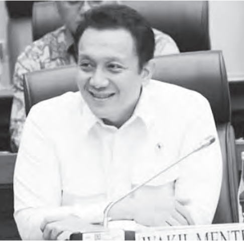
环境部副部长迪亚兹。

（雅加达讯）环境部副部长迪亚兹表示，多家公司因涉嫌引发苏门答腊洪灾而被查封。目前已有四家公司被查封。迪亚兹于12月9日（周二）告诉记者表示，已有四家公司被查封，并且安置监理委员会和公共设施许可证（PPLH）的封条。他指出，环境部仍在传唤巴塘托鲁河流域（DAS）的八家公司。周一（12月8日）已对四家公司进行了检查，周二（12月9日）又对另外四家公司进行了检查。迪亚兹表示，查封工作自12月5