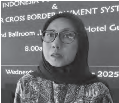
维迪表示, 印尼与大马来西亚跨境QRIS交易量在东盟中最高。

例如, 印尼QRIS和马来西亚QR DuitNow自2023年起已实现互通, 因此马来西亚民众在印尼可通过本国金