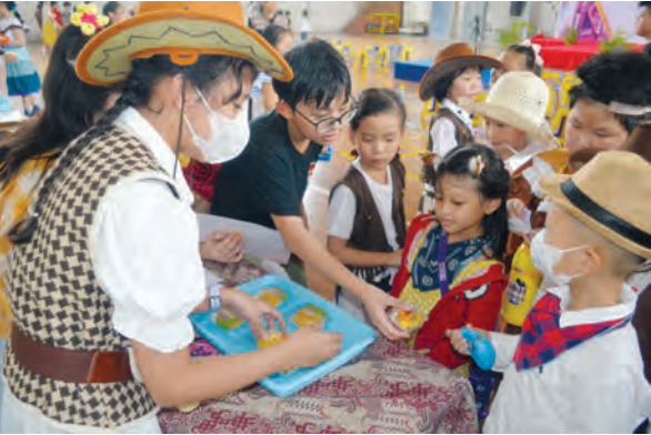
学生们热情推销各种传统美食点心。

上午8时，一、二、三年级的学生率先登场，带来备受期待的国际服装秀。孩子们身着来自不同国家与文化背景的传统服饰，色彩鲜明、细节精致；他们自信走上舞台，姿态可爱又大方，宛如一场迷你“世界文化巡礼”。 在服装秀中，各种精美服装造型令人目不暇接：有的孩子戴着宽沿草帽、披着彩条披肩，手里抱着小吉他，在灯光下再现拉丁风情；有的穿上传统羽饰头冠，脸上点缀部落图腾，走台步时气势十足；也有学生穿着代表美国文化的星条服饰，高顶帽、披风和亮色西装外套在舞台上格外抢眼；还有学生化身维多利亚风格的小绅士与小淑女，优雅的裙摆、整齐的礼服营造出浓浓的欧洲古典气息；穿着中国旗袍与唐装的学生气质十