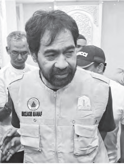
穆扎基尔允许国际援助物资进入亚齐。

Tagana）、警署（Polsek）和军区司令部（Koramil）的人员共同扑灭。火灾原因目前尚不清楚。据推测，火灾是由存放在一楼并正在测试的无人机电池爆炸引起的，随后火势蔓延至其他楼层。该建筑位于雅加达中区马腰兰，是一家无人机销售公司的办公和仓储设施所在地。据多名目击者称，火焰突然从一楼窜出，并伴有一声巨响。几分钟内，浓烟弥漫，紧急出口楼梯被堵塞。整栋大楼迅速被浓烟笼罩，许多员工被困，尤其是高层员工，他们无路可逃。当所有出口都被完全封锁时，恐慌情绪迅速蔓延。他们选择跑到楼顶呼救，并向刚刚赶到现场的消防员挥手致意。救援过程十分紧张；被困人员被绳索一一吊下，而低层楼顶仍然浓烟滚滚。当最后一名被困人员安全着陆时，现场响起了欢呼声和如释重负的呼喊声。截至下午，消防员仍在对多个区域进行冷却，以确保没有余烬残留。有几名员工因吸入浓烟而出现呼吸困难，已被紧急送往附近医院。（LCW）