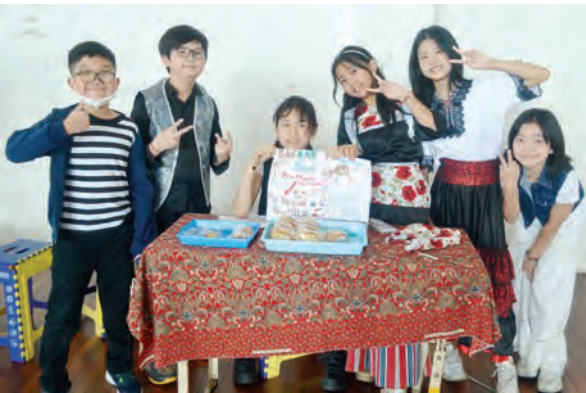
学生们在摊位前推介各国美食。

（泗水讯）12月8日上午，泗水小太阳三语学校热闹非凡，小学部师生共同参与一年一度的“国际日”（International Day）庆祝活动。校园内洋溢着浓厚的国际文化氛围，从服装秀到美食展卖，再到各国主题教室布置，学生们用创意与热情呈现了一场跨文化的盛宴。