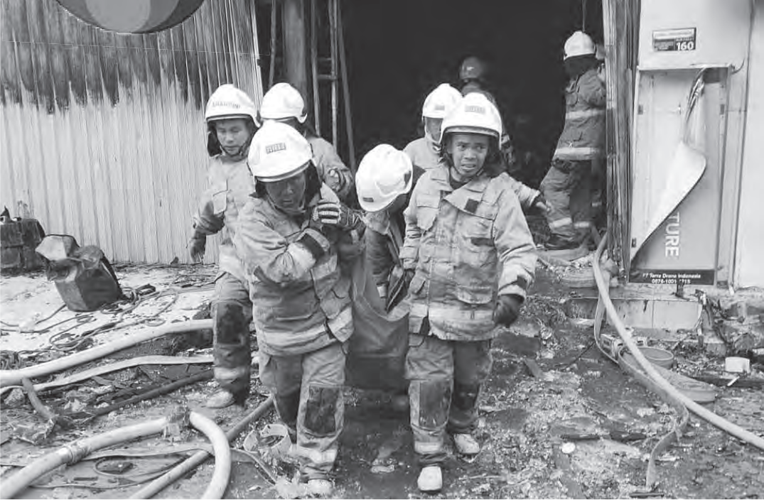
消防员将罹难者的遗体抬出火灾现场。

（雅加达讯）雅加达市中区马腰兰（Kemayoran）北珍巴卡布提（Cempaka Putih Utara）区的一栋大楼于12月9日（周二）发生火灾。至截稿为止，死亡人数已达22人。22名死者当中，其中男性7人，女性15人。雅加达地区灾害管理署（BPBD）署长伊斯纳瓦.阿吉表示，火灾发生在印尼西部时间中午12时43分左右。28辆消防车赶赴现场。起火的大楼是Terra Drone大楼。