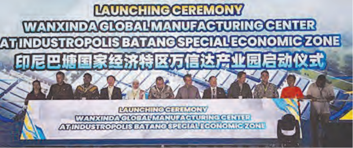
总统办公室主任等官员与入驻万信达企业代表启动投产仪式。