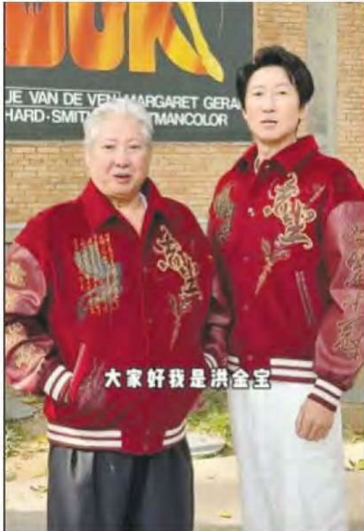
(香港讯) 现年73岁武打巨星洪金宝早前开设抖音账号，出镜被指

回春不少，引起网民阴谋论，质疑他注射了“神秘液体”，让身体状态恢复年轻，许多影迷对谣言表示愤怒，希望洪金宝作出澄清。洪金宝长子洪天明日前作客好友吴家乐及邓兆尊主持的网络节目《娱乐好好玩》，他在节目中也谈及爸爸洪金宝的健康近况，解释了他有时不用坐轮椅的原因。 据《星岛头条》报导，洪金宝近年多次被目击行动不便，需要拄拐杖或坐轮椅出行，被指健康每况愈下。但早前他上传多条抖音影片，可见状态比之前精神，行动也比以前敏捷，引发注射“神秘液体”的谣言，甚至有人称他接受“治疗”后已不用再坐轮椅，身体机能像年轻了几十岁。 洪天明在《娱乐好好玩》中代为回应，表示：“有些人不仅说我爸爸洪金宝，也说李连杰……不一样的啦！我就问‘你有没有吃什么药或者做了什么？’其实网上有很多揣测，说什么治