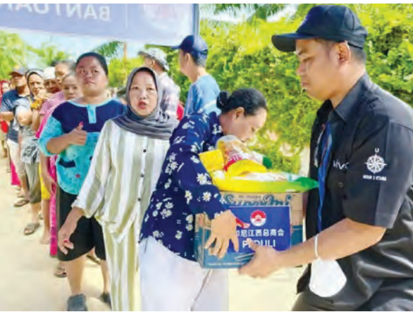
队员亲手把赈灾品送予灾民们。

(雅加达讯) 2025年11月以来苏门答腊岛多地遭遇罕见强降雨, 引发大范围洪水与泥石流灾害, 造成严峻的人员伤亡与财产损失。作为长期在印尼创业、经商、扎根发展的赣籍侨胞, 印尼江西总商会始终心系当地人民安危, 第一时间向全体会员发出紧急募捐倡议, 三天内共筹集善款 1.08 亿印尼盾, 全部用于采购大米、面粉和食用油等紧缺生活物资。