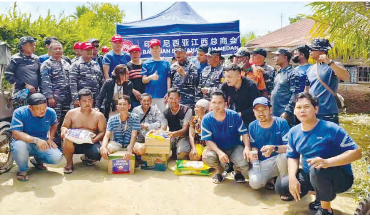
赈灾队伍深入棉兰灾区一线开展物资发放。

全体会员的爱心与力量。彼等坚信, 每一份善意都会点亮一户家庭的希望, 每一次行动都能帮助灾民迈向重建的第一步。愿灾区早日恢复生机, 愿我们携手同行, 共渡难关。我们愿守望互助和同舟共济。