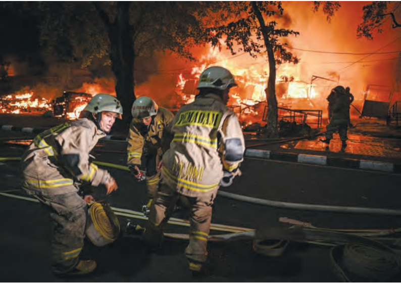
消防员忙着扑灭火势。

（雅加达讯）雅加达南区班芝兰卡利巴达（Kalibata）烈士陵园附近地区于12月11日（周四）晚间发生骚乱事件。这场骚乱起因是当天下午3时30分左右，有两名讨债人（debt collector）在卡利巴达路遭到围殴，造成两人死亡。