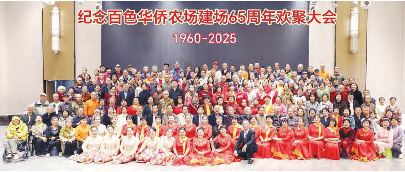
归侨们在65周年欢聚会合影。