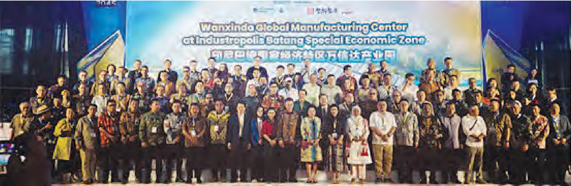
邀请贵宾见证万信达产业园启动仪式合影。

下午2点钟举行“黄金印尼2045论坛”；晚上19:30在三宝壟市巴特马五星级酒店宴会大堂举行96桌席的“印尼—深圳”答谢晚会；10日上午分路人马前往瞻仰郑和下南洋船队多次补给点——三宝壟的三保洞古迹景点和在巴特马五星级酒店举行100多位政企研讨及项目对接意向资讯论坛活动。(阿原于三宝壟供稿)