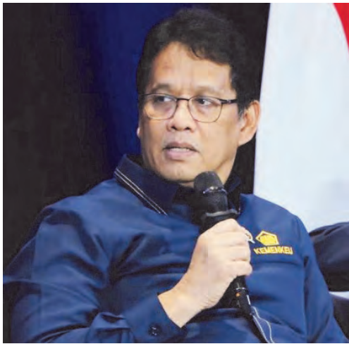
财政部长普尔巴亚。