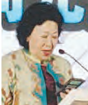
国家经济委员会副主席冯惠兰主旨演说。