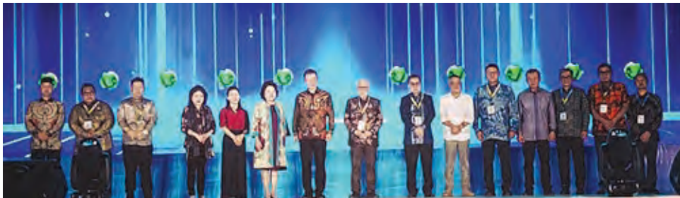
托马斯全球投资服务中心成立启动仪式贵宾上台合影留念。

时分享了万信达控股集团：二十多年来在广州、湖南、越南、缅甸、印尼投资建厂的创业人生经历，如今到印尼来响应国家政府号召企业出海深化“一带一路”战略，结合落实在印尼“全球海洋支点”构想的引领下，从2023年5月10日投资签约以来，定心生根在“巴塘工业城经济特区”耕耘建设厂房和招商引资的工作历程，就是为了表明万信达与更多企业家一起肩负着推动中印尼关系发展的重要使命。