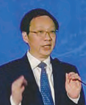
南南合作金融中心吴忠总干事主旨演讲。