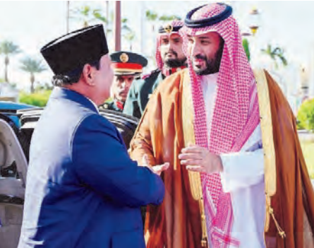
普拉博沃总统与沙特阿拉伯王储兼首相穆罕默德会面的档案照。

此次通话再次巩固了印尼与沙特阿拉伯在人道主义、发展合作以及宗教服务领域的不断深化的双边关系。印尼政府希望此次