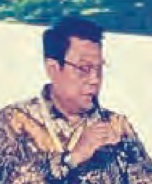
印尼巴塘工业城经济特区(KITB)董事长致辞。