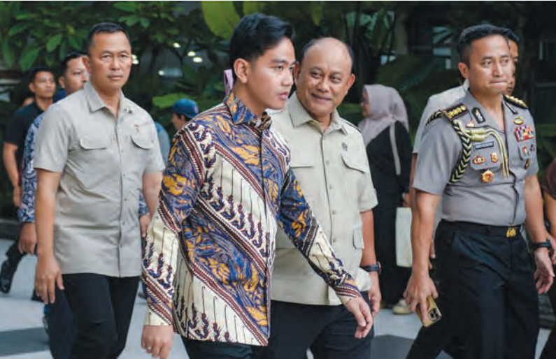
吉布兰前往医院探望伤者。

关机制，而司机的招聘应遵循国家营养机构规定的技术指导。该机构已制定车辆运营适格性检查的技术规范，各合作单位都必须按要求执行。