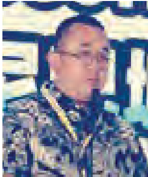
三宝壟市巴塘县长致辞。