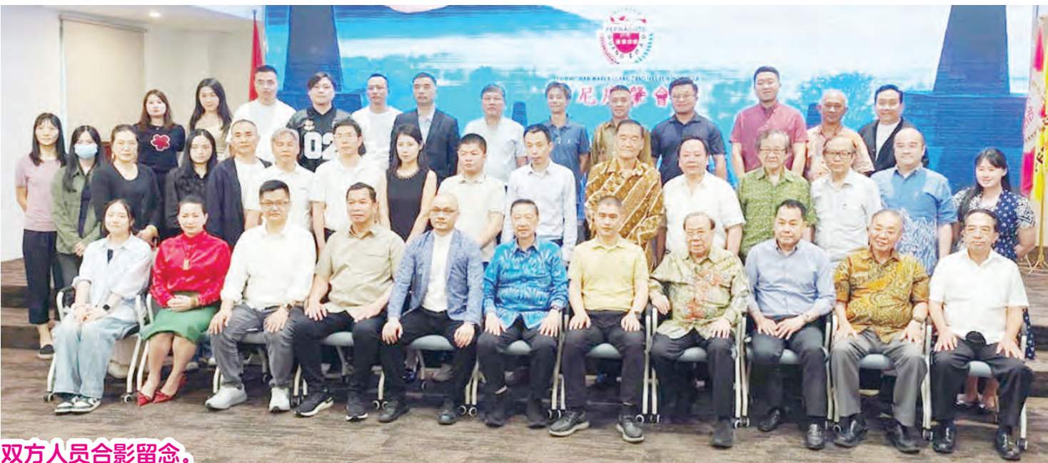
双方人员合影留念。