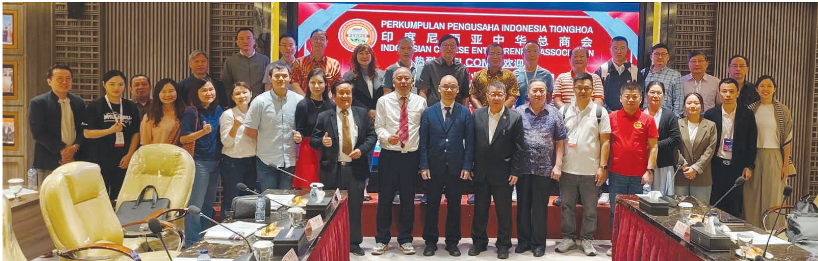
双方代表合影留念。