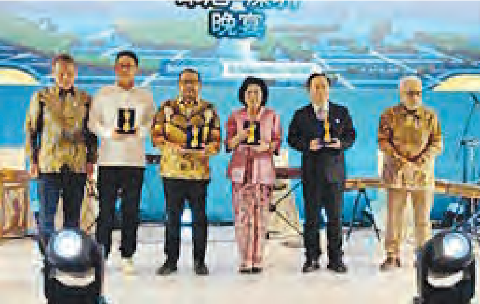
托马斯全球投资服务中心高级顾问合影。

(三宝壟讯) 12月9日上午9时由印尼国家投资部、印尼黄金社会论坛、中国-东盟产业合作发展促进会主办，印尼巴塘工业城经济特区、智纲智库、南南合作金融中心、万信达控股集团承办以“向光同行·共筑黄金印尼2045机遇”为主题的入驻企业联合投产、黄金印尼论坛、印尼深圳晚宴系列盛大活动，在中爪哇省三宝壟市巴塘国家经济特区万信达产业园内举行，自来印尼国家部长、参会的省长、官员及相关国营企业老总和印尼华社精英、中资商会领导、企业家(包括入驻印尼企业)韩国人驻万信达企业总裁和知名专家、投资者达到1000位，其中中资企业代表700多人。