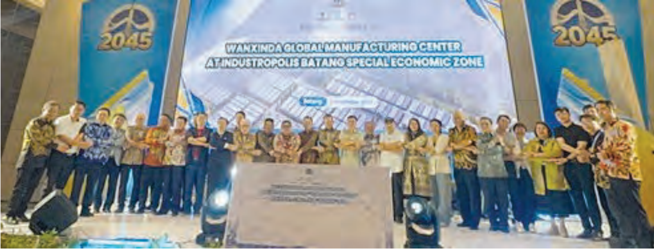
答谢晚宴启动“印尼——深圳”文化符号手牵手合影。