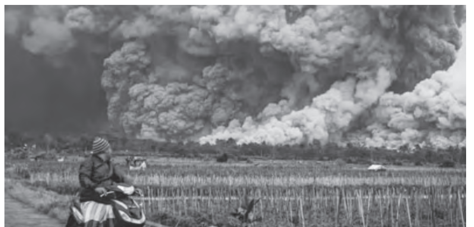
火山爆发，居民逃离家园。