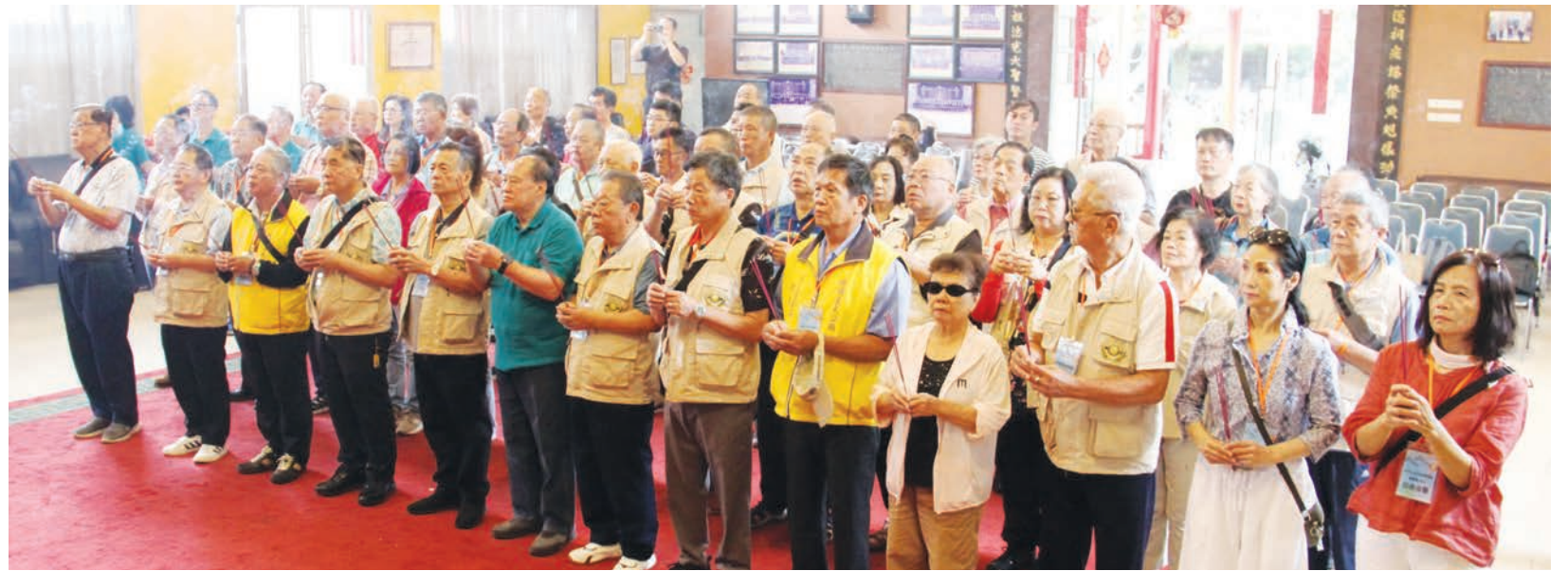
全体宗亲向祖先上香。