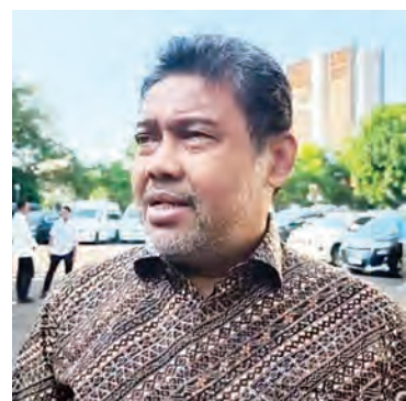
赛义德表示，两家日本公司将离开印尼。

PT S。据他从工会获得的信息，这两家公司的母公司位于日本，认为在越南发展电动汽车更具优势。因此，这两家公司将离开印尼。