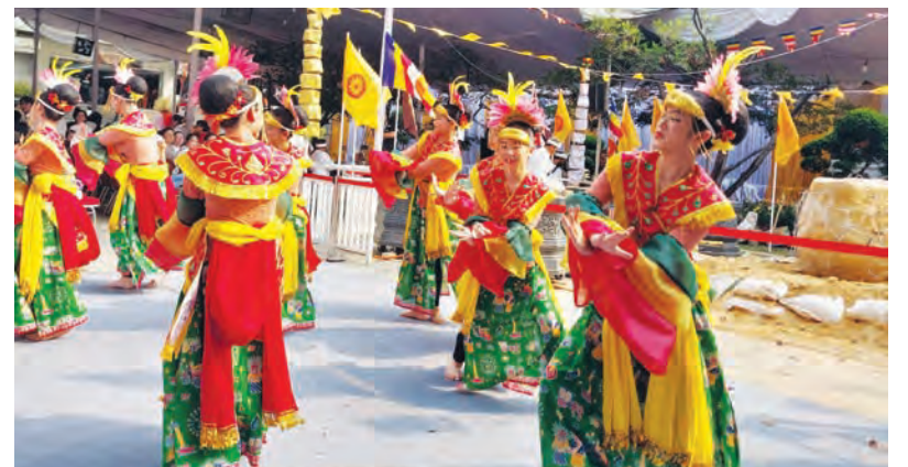
为纪念印尼僧伽上座部佛教协会成立五十周年而举办的预热活动, 包括地方舞蹈和歌曲表演。