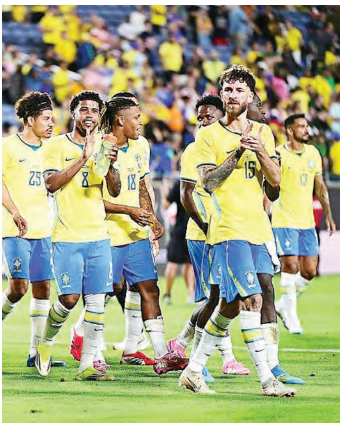
拉美劲旅巴西国家队，人才被欧洲吸纳。

今届法国二十六人大名单中，就有多达二十三名球员是移民及其後代。除法国以外，传统劲旅英格兰、西班牙，以至近十数年新进的葡萄牙、比利时更依赖移民大军的支持。各队移民及移民後裔球员大致如下：瑞士十七人，英格兰十五人；荷兰十四人，葡萄牙十二人。欧洲的殖民主义、近年的难民政策虽然备受批评，但也为国家带来众多劳动力，在足球领域的贡献亦非常明显。如上述的荷兰，在一九七五年苏里南独立时就有三分之一人口移民到荷兰，历年成为重要的足球人才库。