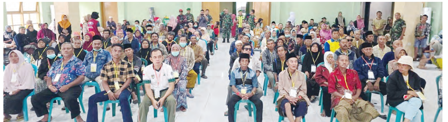
白内障患者在大厅等候。