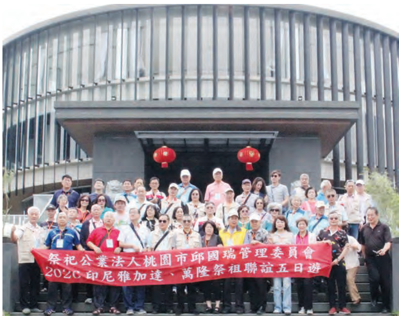
台湾丘邱氏在印尼华族文化中心建筑物前留影。