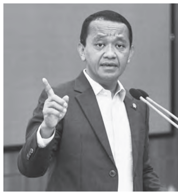
能源与矿务部长巴赫里尔。

他说：“我们恳请全体民众为我们祈祷并予以支持，以便我们所有的努力都能顺利进行。”（ALW）