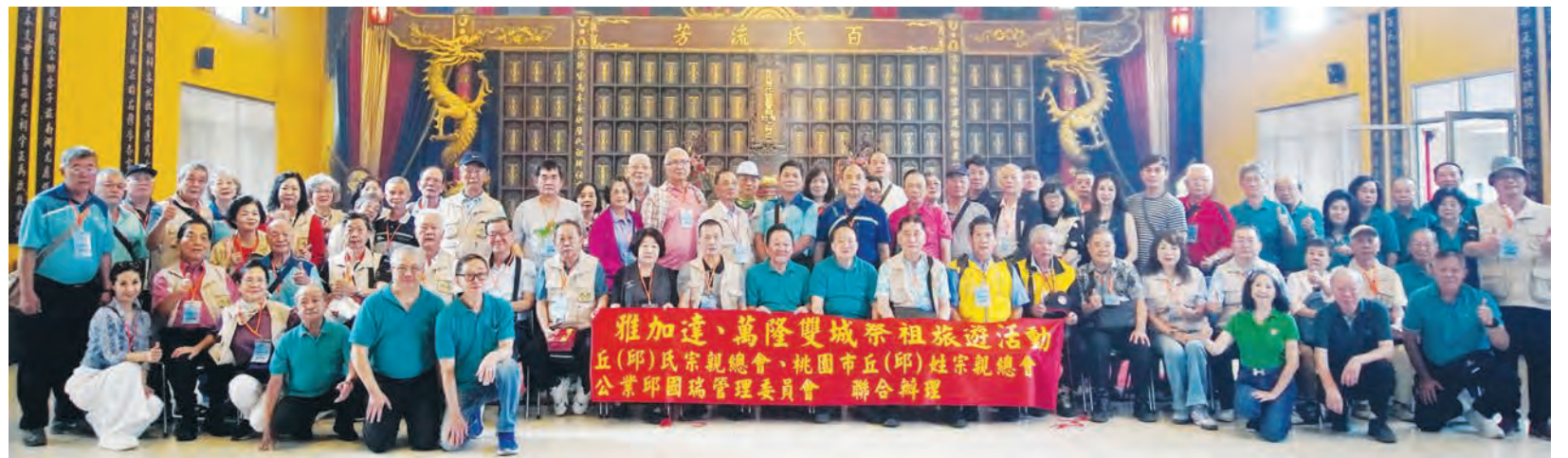
宗亲们在百氏祠合影。