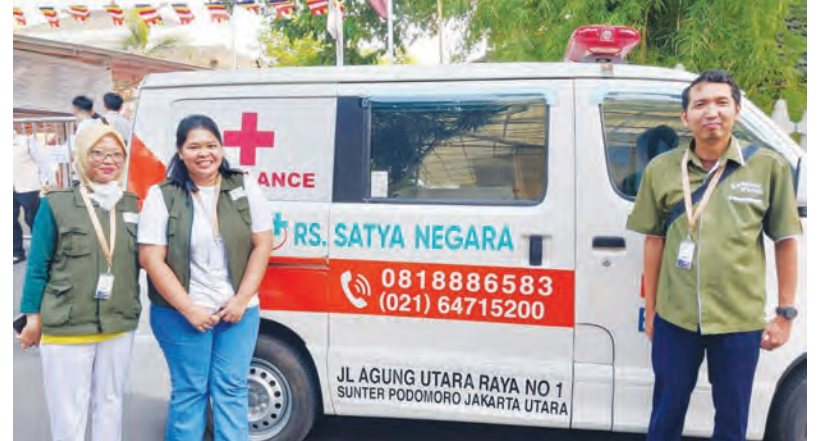
雕像铸造仪式筹委会为意外事故提供由萨蒂亚·内加拉医院提供的急救服务。

来自阿默莎艺术工作室的十三名工人/工匠/艺术家正在融化黄金和铝金属, 直至融化。之后, 他们将这种铝金混合物倒入雕像模具中。