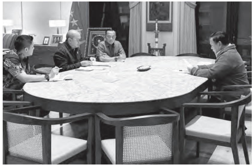
普拉博沃(右)与罗桑(左二)讨论优化国有资产管理。