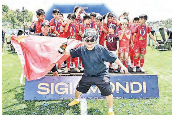
董路(中)与他的野路子青训成员，以赛代练。

足球评论员董路在二零一七年发起民间青少年足球项目，以组织国内外比赛为训练方式。截至二零二五年，其二零零九年龄段队伍共参加了百多场国际比赛，而在近期U17亚洲杯里，国足杀入亚洲杯决赛，最终仅以二比三败予日本队，令球迷眼前一亮，认为董路「野路子」以赛代练方法或成国足突围的奇兵。