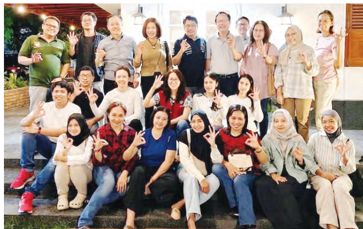
亮眼之光基金会领导和医生团队在用餐后合影。