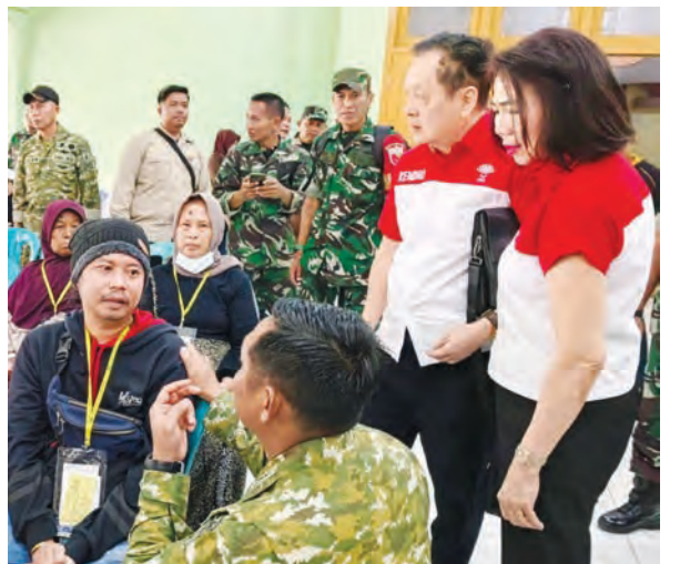
卢奇司令在慰问患者。